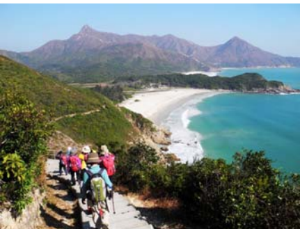
▲白砂のビーチとシャープピーク