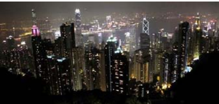
▲百万ドルといわれる夜景(イメージ)

※右記日程は利用航空会社、現地事情などにより変更になることがあります。 ※現地の状況により、ハイキングコースは変更される場合があります。