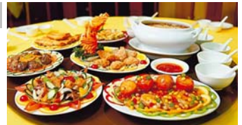
▲香港グルメもお楽しみに(イメージ)