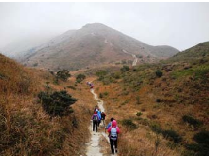
▲鳳凰山山頂へと延びる登山道