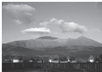
▲メルー山を望むアルーシャ国立公園のロッジ

キリマンジャロとメルー山の間にあるアルーシャ近郊の国立公園。森林帯でのサファリが主で、マサイキリンの群れに出会うことが多いです。宿泊するロッジ周辺に集まるキリンの姿にはきっと驚かされることでしょう。運が良ければモメラ湖に生息する数千羽のフラミンゴに出会うことができます。