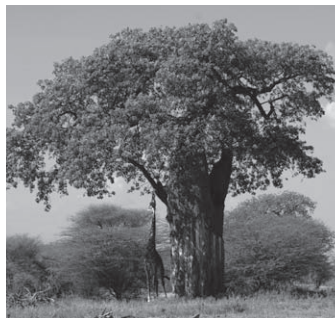
▲バオバブの巨木が印象的なタランギレ国立公園

タランギレ国立公園は、樹齢数百年もあるバオバブの巨木とアフリカゾウの群れが有名です。シーズンには、近隣の国立公園からヌーやシマウマなど大移動する草食動物達が水を求めて、タランギレ・リバー周辺に戻ってくるため、ライオンなどの肉食動物もその群れを追ってやってきます。また、開けたアカシア林にたくさんのバオバブがあるため、猛禽類や多様な鳥類の宝庫としても有名です。