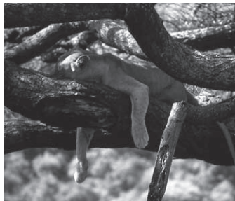
▲マニヤラ湖国立公園で出会った珍しい木登りライオン

マニヤラ湖国立公園は、フラミンゴが集まるソーダ性のマニヤラ湖と森林、草原からなり、大地溝帯(グレート・リフト・バレー)の断崖の下に広がる国立公園です。豊富な水と様々な植生が、ヒビヤシマウマ、バッファロー、ヌー、インバラ、カバ、ペリカンをはじめ、多様な動物達を支えています。木登りをする珍しいライオンを観察できることでも有名です。