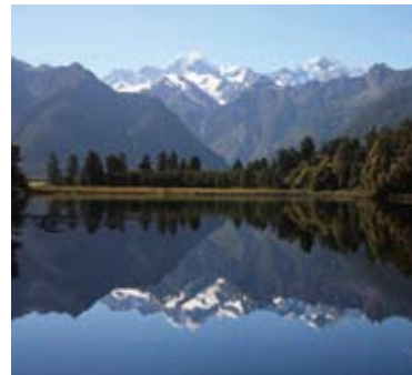
▲マセソ湖よりのぞむ、美しいサザンアルプス(10日目)

サザンアルプスで最も標高の高い稜線を境にして、その分水嶺から西海岸まで広がるウエストランド国立公園は、世界遺産に指定されています。海拔の低いところにまで達している氷河が特徴で、その代表のひとつであるフォックス氷河は、NZ最高峰マウントクックに源頭を有し、NZ随一の長さを誇ってゆっくりと流れ、手付かずの原生林は、太古の姿を今日も残しています。