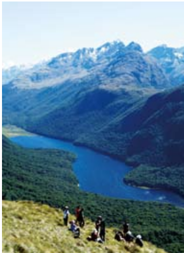
▲広々としたグリーンストーン谷を見下ろす(5日目)

の中のコースで、概ね平坦な川沿いのトラックを歩きます。4日目にグリーンストーン峠を越え、ハウデン湖よりルートバーントラックに合流し残りの2泊3日の山岳ルートを楽しみます。