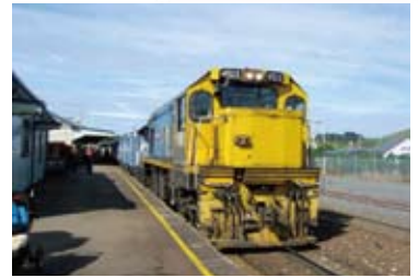
▲カンタベリー平野を走るトランツ・アルパイン号に乗車