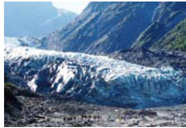
▲巨大なフォックス氷河の間近に迫る