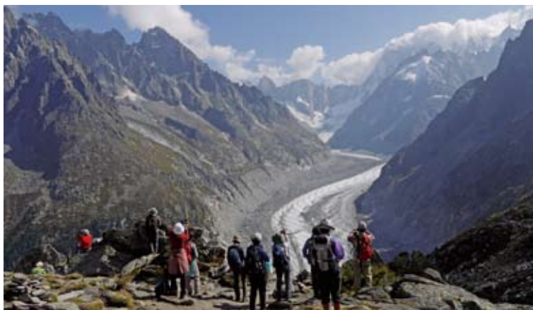
▲「氷の海」メールド・グラスを見下ろしながらモンタンパールへ(10日目)

このマーク出発日は「クルム・ゴルナーグラート」で「マッターホルンが見えるお部屋」を予約! (※シングルルームを除く)