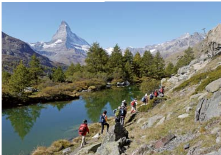
▲マッターホルンを倒影する3つの山上湖を巡るハイキング。写真はグリンジゼー (5日目)