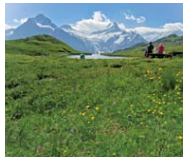
▲美しい山上湖、パッハアルプゼー (8日目)