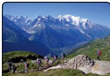
宝石のようにきらめく湖、ラックブランへのハイキング。シャモニ谷をはさんで、モンブラン山群の大パノラマが広がります。(11日目)