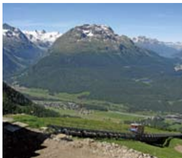
▲ベルニナ山群とエンガディンの谷を一望するムオクス・ムラ・コ展望台(2日目)