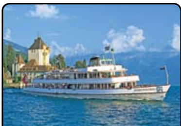
アルプスから流れる水をたたえるトゥーン湖をクルーズ。白銀のアルプスや、湖畔の美しい風景を見ながらのお食事は格別です。(6日目)