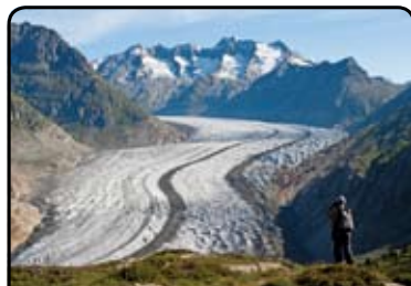
モースフルー展望台からは、アルプス最長のアレッチ氷河を一望することができます。 ※6/13、6/21出発のみ。(4日目)

河峰、色とりどりのお花畑、のんびりと草を食む牛や羊、素朴な集落や人々の生活など、アルプスの様々な光景を眺めながら、6回のハイキングを楽しみます。またこのツアーはマッターホルンを望む山上のホテル「クルム・ゴルナーグラート」をはじめとして、各リゾートでは連泊となり、ゆとりある日程で、アルプスを心ゆくまで堪能いただけます。