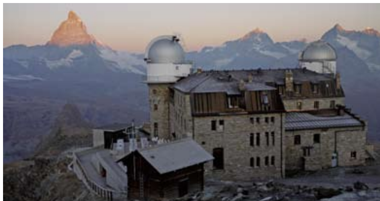
▲クルク・ゴルナーグレートから見る、マッターホルンと周囲の山々の朝焼け(6日目)

絶景の展望台に建つ数ある山上のホテルの中で、最も人気があるのがクルク・ゴルナーグレートでしょう。マッターホルンやモンテローザなどの名峰に囲まれ、眼下に流れるゴルナー氷河の眺めも素晴らしいものがあります。モンテローザの夕焼け、マッターホルンの朝焼け、そして夜は満点の星空と静寂の一夜…アルプス本来の素晴らしさを味わうことができます。特別な場所です。