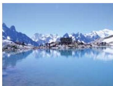
▲ラクブランからのパノラマ。右がモンブラン(8日目)