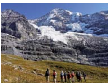
▲モンビ(4,107m)とアイガー氷河を見上げる(4日目)