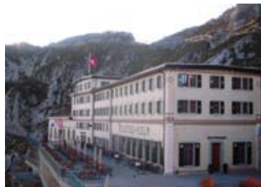
▲ピラトゥス・クルム外観