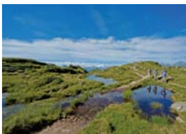
▲モースフルーからはヴァリス山群の山々もよく見える(10日目)