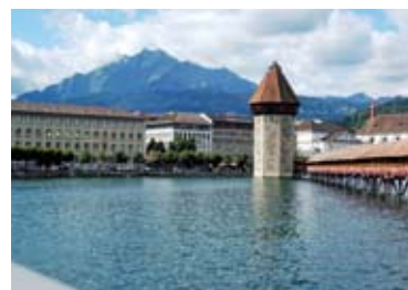
▲美しい湖畔に佇む、歴史ある街ルツェルン(2日目)