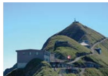
▲山上のホテル、ロートホルン・クルム外観