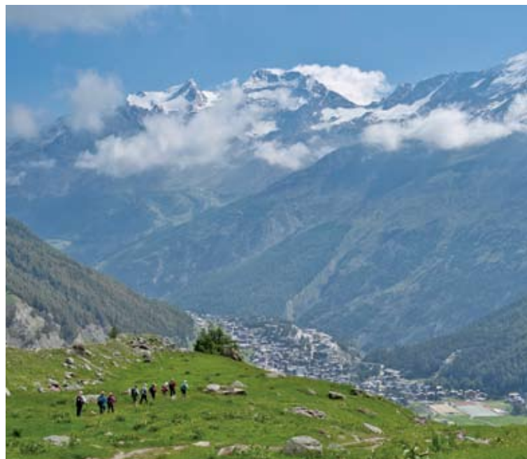
▲花咲く草原を歩くサースフェーでのハイキング(7日目)