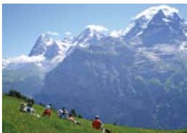
▲アルメントフェーベルから歩く「花の道」(5日目)

することができます。絶景の展望台に建つもう一軒の山上のホテル、ロートホルン・クルムに宿泊した後は、3つのカーフリーリゾート(ガソリン車の乗り入れが禁止されている村)へ。ミュレンでは大きく迫って見えるアイガーやユングフラウを別の角度から展望し、4,000m峰にぐると囲まれたサースフェーでは、氷河村の別名の通り村のすぐ上にまで迫る氷河の眺めが見ものです。また、リーダーアルプでは、アルプス最長を誇るアレッチ氷河をじっくりとご覧いただけます。