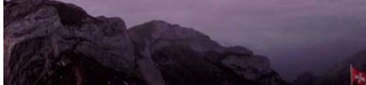
▲雲海に浮かぶベルナー・オーバーラント三山(3日目)