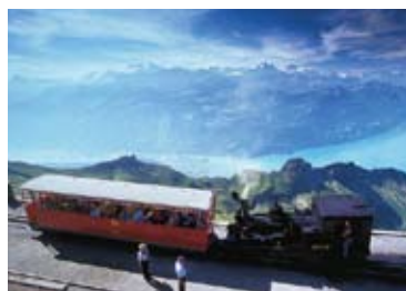
▲ベルナー・オーバーラント三山とブリエンツ湖の展望が素晴らしい

ルン展望台へと向かいます。その展望台に建つ山上のホテルがロートホルン・クルム。眼下に見下ろすブリエンツ湖と、ベルナー・オーバーラント山群の展望をじっくりとお楽しみいただけます。