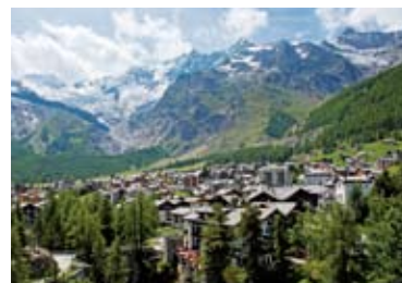
▲4,000m峰に囲まれたサースフェー(6-7-8日目)