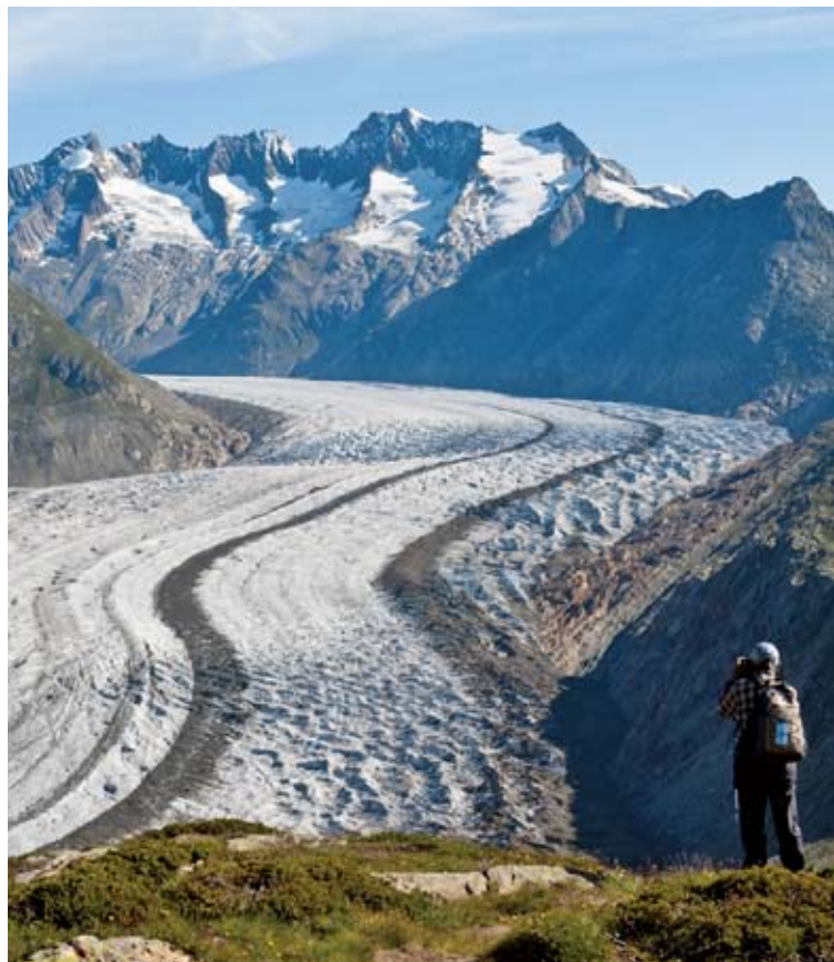
▲モースフルー展望台から見るアレッチ氷河(10日目)