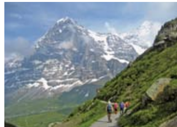
▲ベルナー・オーバーラント三山を正面に見ながら(5日目)