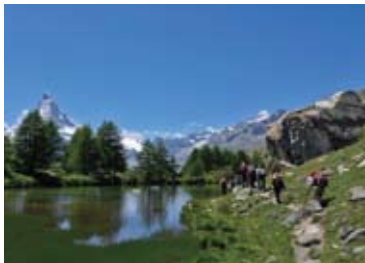
▲マッターホルンを倒映するグリンジゼー(4日目)