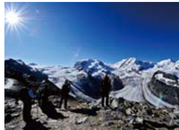
▲モンテローザ(4,634m)と氷河の展望が素晴らしい(4日目)