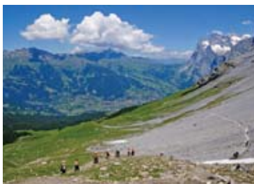
▲北壁の直下を歩くアイガー・トレイル(6日目)