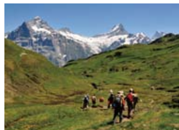
▲ヴェッターホルン(左)とシュレックホルン(中央)が大きい(7日目)