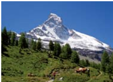
▲マッターホルンの北壁を見上げながら歩く(3日目)