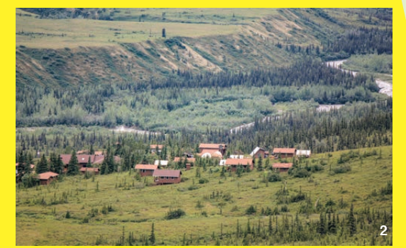
1. ロッジの北側にはデナリが聳える 2. 原野に佇むキャンプ・デナリ 3. 水草を喰むムース