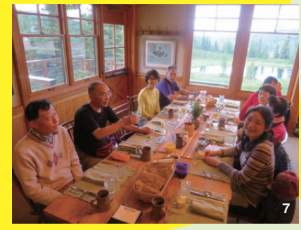
4. ダイニングからデナリを望む 5. 室内は木のぬくもりであふれる 6. ロッジ前の池にデナリが映る 7. 楽しい夕食の時間