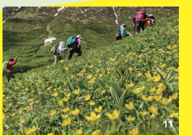
10. ヤナギランの仲間 11. 夏は様々な花がツンドラの原野を覆う