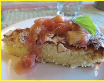
8. 鮮度の高い食材がふんだんに使用される 9. 手作りのスイーツも好評