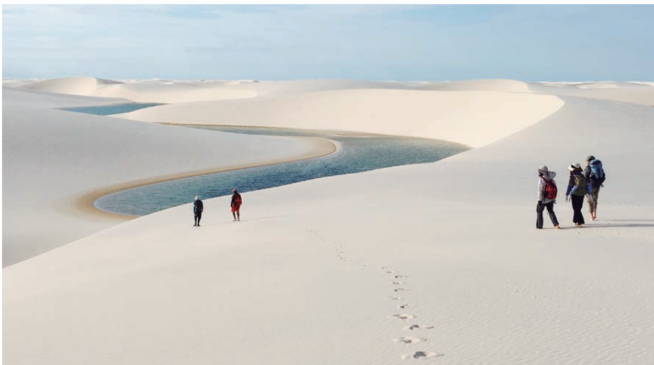
▲2泊3日で白砂漠縦断トレッキングの大冒険へ！

真っ白な砂丘が美しい曲線を描きながらどこまでも続く光景を見れば、レンソイスが「白いシャツ」という意味であることも納得です。雨期に降った雨は地下水脈に蓄えられ、乾期になると染み出します。