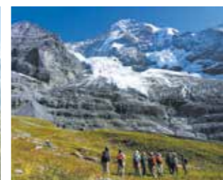
▲迫力あるアイガー氷河を望む