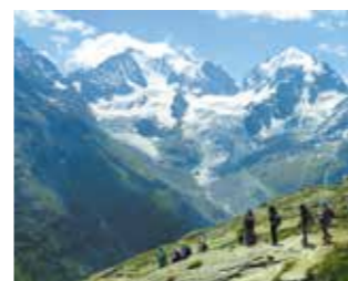
▲ベルニナ山群展望ハイキング

BOTAに加盟する山岳リゾートのサンモリッツ、グリンデルワルトでの3連泊に加え、マッターホルン山麓のツェルマツにも宿泊します。スイス・アルプスを代表する3つの山群のほかに、スイスの隠れ里ソーリオ村でのハイキング、氷河特急の全線乗車もお楽しみいただけます。創業50周年を記念する特別ディナーにもご期待ください。