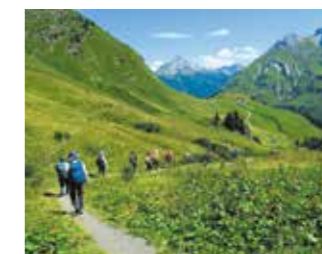
▲レッヒでゆったりハイキングを楽しむ

連泊型のゆったり日程で、人気の2大エリアを訪問します。チロルではレッヒに3連泊してハイキング。自然と調和したレッヒの、知られざる環境施設も特別に訪問します。ゼーフェルトを経て、ドロミテのコルチナへ。名峰ドライ・チンネンを望むハイキングを楽しみ、現地で盛んなアグリツーリズムのレストランでの夕食で旅を締めくくります。