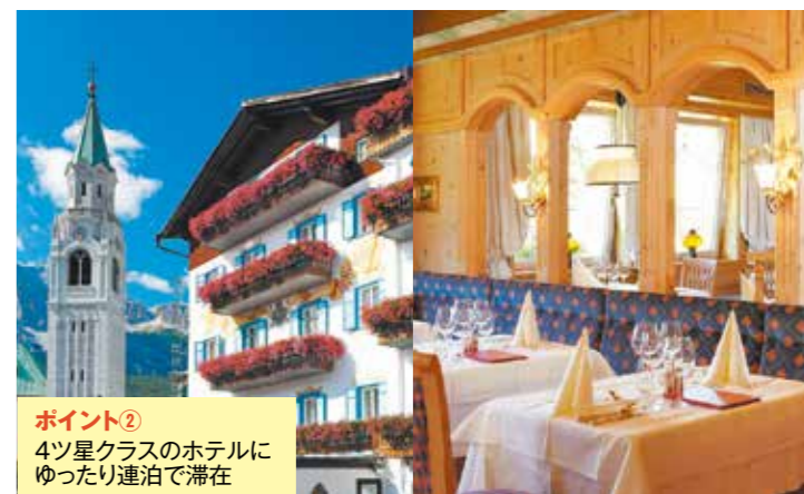
ポイント② 4つ星クラスのホテルに ゆったり連泊で滞在