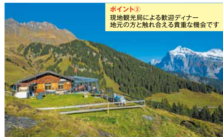
ポイント③ 現地観光局による歓迎ディナー 地元の方と触れ合える貴重な機会です