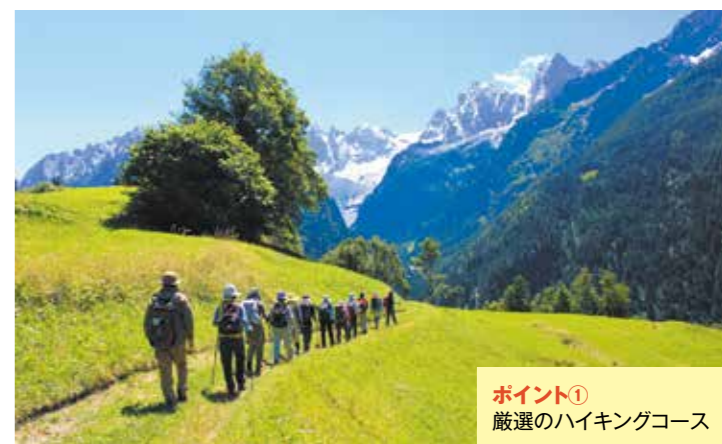
ポイント① 厳選のハイキングコース

Best Of The Alps ベスト・オブ・ジ・アルプス(略称“BOTA”ボタ)とは、ヨーロッパ・アルプスの中でも、歴史・文化・名峰などの条件が揃ったヨーロッパ・アルプスを代表する山岳リゾートにだけ加盟が認められるグループです。そのためBOTAの山岳リゾートでは、7回のオリンピック、9回のアルペン・スキー世界選手権をはじめとした、たくさんの世界的なスポーツイベントが開催されてきました。現在でもBOTAリゾートは、王侯貴族からハイキング愛好家まで、自然を愛する人々が四季を通じて訪れる傑出した山岳リゾートです。2つの特別企画では、Aコースのサンモリッツ、グリンデルワルト、Bコースのレッヒ、ゼーフェルト、コルチナにそれぞれ連泊で4つ星クラスのホテルに滞在しながらハイキングをお楽しみいただけます。アルプス随一の山岳リゾートでの快適な滞在と、雄大なアルプスの大自然にご期待ください。