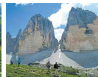
▲名峰ドライ・チンネンを望む