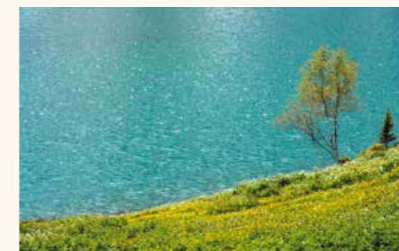
▲夏には花々が咲く高原を歩く