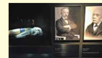
▲150年以上の歴史を誇る

スイス発の世界的アウトドアブランドであるマムートが創立した登山学校で、アルプスを知り尽くす優秀なガイドが数多く所属し、スイスらしい質の高いサービスを提供しています。そもそもマムートは1862年に創業した歴史あるブランドです。元々は工業用ロープを製造していましたが、その技術を生かし、クライミングロープも手掛けることでアウトドアブランドとして確固たる地位を築きました。長年にわたりスイス・アルプスをご案内してきたアルパインツアーと、マムート・アルパインスクールのコラボレーションでご案内するのが、ヴィア・アルピナ・トレイルの山旅なのです。