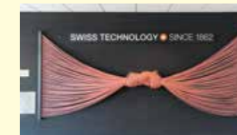
▲本社ビル入口に飾られたロープのオブジェ