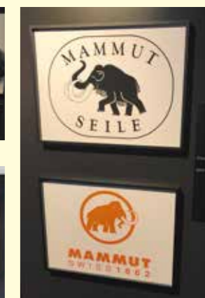
▲かつてロゴマークは反対向きだった