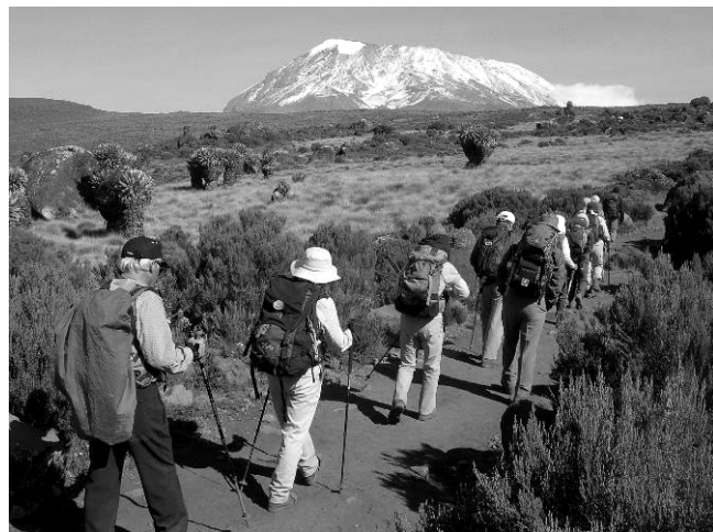
▲草原帯をキボ峰へ向け進む(6日目)

●利用予定航空会社: KLMオランダ航空 ●ツアーリーダー: 大阪から大阪まで同行します。 ●最少催行人数: 10人 ●食事: 朝9回、昼8回、夕8回 ●利用予定ホテルリスト: Bクラス以上/世界の山旅P44をご参照下さい。 ●現地ガイド、コックが同行。荷物は各山小屋までポーターが運搬。 ●行動範囲: 1,800m～5,895m、最高宿泊地4,703m、高山病の影響あり。 ●一人部屋利用追加料金: ¥34,000(ロッジ泊含む、山小屋泊除く)