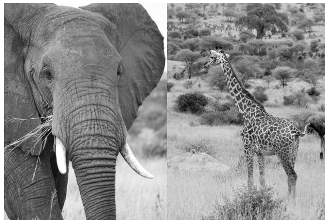
▲下山後のサファリも楽しみ