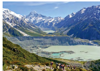
▲Mt.クックの展望ハイキングへ出かける

マウントクック村にはNZ最高峰のアオラキ/マウントクックの展望を楽しめる展望地が複数あり、その日の天候などによって一番いいハイキングコースのご案内をします。