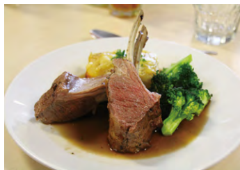
▲ロッジの食事は大好評

ロッジでの夕食は前菜、選べるメイン、デザート3コースの食事が提供され好評です。昼食用に持参するサンドウィッチはバラエティーに富んだ食材から自分で作ります。