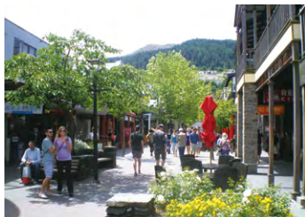
▲華やかな雰囲気のリゾート、クイーンズタウン

景観の美しい人気のリゾート地クイーンズタウンでは、連泊してトレッキングの疲れを癒やしながら開拓時代の雰囲気が残るアロータウンやワナカ湖など周辺の散策に出かけます。