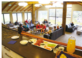
▲ロッジのラウンジでくつろぐトレッカー達

ルートバーン・トラックのロッジは共有の温水シャワーや水洗トイレ、洗濯場と乾燥室が完備されています。男女別の相部屋ですが清潔なベッドでゆっくりと疲れを癒やせます。