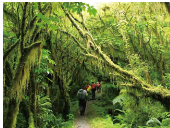
▲ブナ、シダ、コケが美しいミルフォードの原生林

世界中のトレkkerが憧れるミルフォード・トラックは、約54kmの行程を山小屋3泊4日で踏破する歩き応えのあるコースです。入山制限によって守られた緑豊かなブナの原生林やフィヨルドランドの峻峰群など、幻想的かつ迫力ある風景を堪能します。トレイルは歩きやすく整備され、ミルフォードトラック専任ガイドが先頭と最後尾を歩くので、その間をご自身のペースで歩くことができます。外国人トレkkerとの交流も楽しみです。