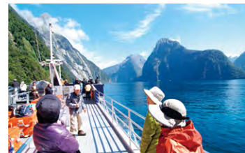
▲歩いた後はミルフォード・サウンド・クルーズを楽しむ

フィヨルド地形が圧巻のミルフォード・サウンド・クルーズは海面から岩峰が聳え、イルカやアザラシなどが愛らしい姿を見せてくれます。