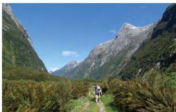
▲氷河が作ったU字谷の中を歩く

氷河が作ったU字谷の中、鬱蒼としたブナとコケの原生林歩き、快適なロッジに泊まり、手つかずの自然を楽しむのがミルフォードです。