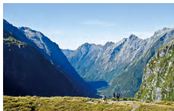
▲マッキノン峠から歩いてきたU字谷を見おろす

ミルフォード・トラックのハイライトがマッキノン峠です。峠からは氷雪を抱いた山々が間近に迫り、歩いてきたU字谷が横たわります。