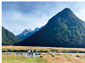
▲ルートバーン・フラットにて

ルートバーン・トラックの後半部分を日帰りで楽しめます。清らかな川の流れとブナの森で清々しい気分を満喫できることでしょう。