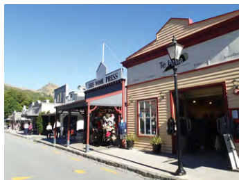
▲開拓時代の零用気が残るアロータウン

クイーンズタウン近くのアロータウンは開拓時代の街並み残る小さな街です。落ち着いた雰囲気の中で散策を楽しめます。