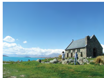
▲テカポ湖畔の善き羊飼いの教会

テカポ湖はミルキーブルーの美しい湖面を見せ、湖の向こうにはサザンアルプスが聳え、湖畔に建つ小さな教会の絶景が楽しめます。