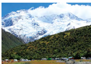
▲眼前に迫るMt.セフトンの懸垂氷河