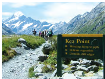
▲マウントクックを望むケア・ポイント

ニュージーランド最高峰のアオラキ /マウントクックを望む展望台。氷 河の向こうに聳える山々を往復約 2時間のハイキングで訪れます。