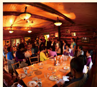
▲ぬくもりを感じるダイニング