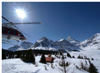
▲アシニボイン山麓のロッジへヘリでひとつ飛び

ヘリコプターに乗り約10分。一気にアシニボインの山麓にあるロッジへ飛びます。そこには、ロッジの宿泊者だけが体験することの出来る絶景が広がります。