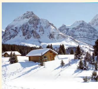
▲宿泊キャビンが点在する人気のアシニボイン・ロッジ

ヘリコプターを利用して一気にロッジの建つアシニポイン山麓へ飛びます。そこにはロッジの宿泊者だけが楽しめる特別な世界が広がります。スノーシューなどで雪遊びをした後は、スタッフのおもてなしが好評のロッジで、暖かい飲み物やお菓子でティータイム。夕暮れになるとアシニポイン・ロッジの魅力の一つでもある洗練された美味しい食事に舌鼓をうち、ゆったりと木のぬくもりを感じるロッジの滞在を楽しみます。