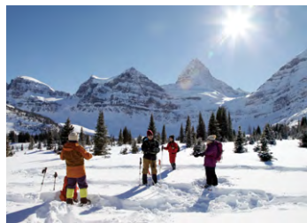
▲ロッジ周辺は格好のスノーシュー・フィールド

冬のアシニポイン山麓は雪に覆われたなだらかな丘や小さなピークなどスノーシューを楽しむには絶好のフィールドです。スノーシューは現地で無料レンタルできます。