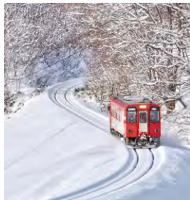
▲冬の秋田内陸縦貫鉄道