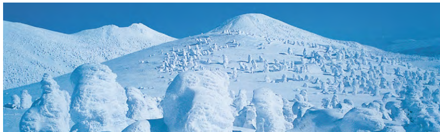
▲冬の八甲田 樹氷林から大岳を望む

1日目 福岡➡大阪➡東京➡青森➡八甲田山の山麓の谷地温泉へ。★酸ヶ湯周辺で軽くスノーシュー・ハイキング(歩行約1時間)。(夕) 谷地温泉(ホテル)