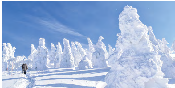
▲森吉山でスノーシューハイキング

樹氷で有名な八甲田山と森吉山でスノーシューを楽しみます。スノーシューを楽しんだ後は、ゆっくりと温泉で疲れを癒します。今回訪れる温泉は 開湯400年の歴史を誇る日本三秘湯「谷地温泉」、秘湯ランプの宿「青荷温泉」、秘境の宿「打当温泉 マタギの湯」、乳頭山麓に点在する乳頭温泉郷のひとつ「休暇村 乳頭温泉郷」など東北の名湯、秘湯を楽しめます。移動の鉄道は冬の津軽地方の風物詩となっている「ストーブ列車」と日本の冬の里山の原風景の中をのんびり走る「秋田内陸縦貫鉄道」の人気のローカル列車に乗車します。このツアーは8名様限定の白銀の東北満喫ツアーです。