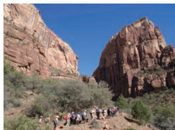
▲ 美しい渓谷ザイオン

深い渓谷と巨大な岩壁が特徴的なザイオンは「神々の国」という意味があります。まさに神々が住むにふさわしいような絶景が満喫できる、アメリカでも人気の国立公園です。