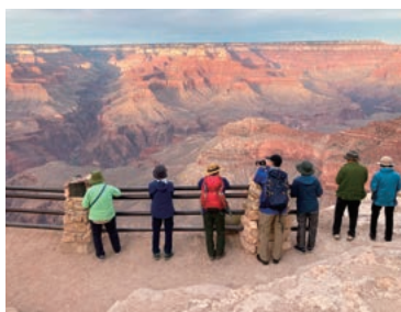
▲ 壮大なグランドキャニオン

アメリカ西部の国立公園の代名詞ともいえるグランドサークルを、9日間の日程で4つの国立公園と1つの特別保護区を巡り、余すところなくお楽しみいただきます。緑豊かな渓谷や、西部劇の舞台となったピュート(残丘)、世界最大の峡谷。それぞれ一つとして他と同じ印象を受ける場所はありません。