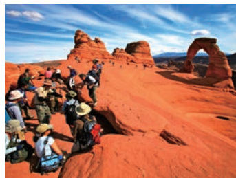
▲ ユタ州のシンボルデリケートアーチ

雨と風が長い時間をかけ、砂岩の大地を削り出来たアーチ状の岩が、不思議な光景を見せてくれます。その姿は千差万別で、まさに大自然が創り出した岩の芸術品です。