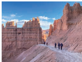
▲ 圧巻のプライスカニオン

ユタ州の南部にあり、自然が作り上げた景観が有名です。そびえ立つ尖塔群の谷底や高台の展望台から、自然の色彩あふれた美しい光景をハイキングで楽しめます。