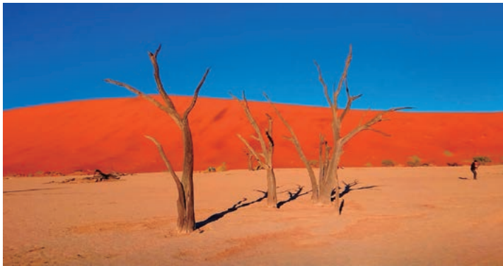
▲ナミブ砂漠最奥のデッド・フレイ

※花の開花状況は毎年の気象条件により異なります。花の咲き具合により上記日程表中の場所ではワイルドフラワーが見られない場合、訪問地やハイキングコースを変更する場合があります。