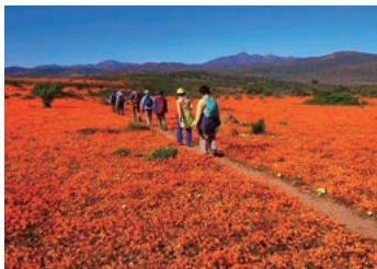
▲ナマクワデザインのオレンジがまぶしい

南アフリカ北ケープ州の乾燥地帯ナマクワランドは一年一度、8月から9月(南半球の春)の驚異的ともいえる花の群生のすばらしさによって、世界屈指の野性の花の宝庫として知られてます。