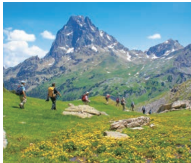
▲ビック・デュ・ミディ・ドゥソワ展望ハイキング

ピレネー山脈の中でも中心部の絶景ポイントを巡りながらハイキングを楽しみます。フランス側からスペイン側へ国境を越え、南北から世界でも屈指の絶景を見ながら歩く秀逸なハイキングをお楽しみください。豊富な高山植物、圧巻の大圏谷、緑美しい高原など、花の宝庫・ピレネーを満喫する人気コースです。