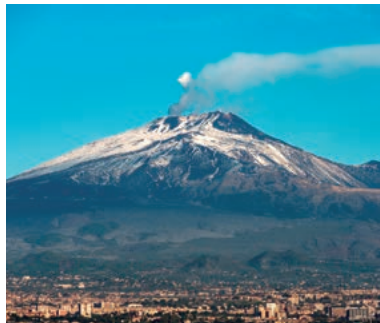
▲シチリア島の名峰エトナ山

イタリアの南部、地中海に浮かぶシチリア島。旅の前半は、まず、イタリア本土のローマやナポリの観光を楽しみ、その後、列車と船でシチリア島に上陸。ヨーロッパ最大の活火山で噴煙をたなびかせるエトナ山(3,326m)や遺跡群のハイキングを楽しめます。おいしいシチリア料理の食事やシチリア文化体験も魅力的です。