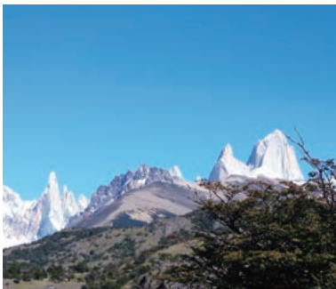
▲セロトーレとフィッツロイを望む展望台より

パタゴニアのパイネ山群とフィッツロイ山群を歩き、雄大なペリト・モレノ氷河ではクルーズ、そして世界最南端の街、ウシュアイアを訪れ、世界三大瀑布のひとつイグアスの滝を観光し、南米大陸最高峰のアコンカグアも展望する、まさに地の果ての大自然の魅力を満喫するコースです。