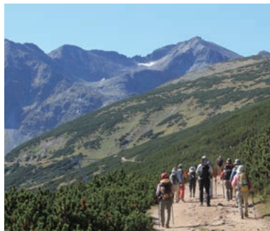
▲ブルガリア最高峰のムサラ山を目指す

ブルガリアの最高峰ムサラ山(2,925m)と第二峰ビフレン山(2,914m)に登頂します。ムサラ山は圧倒的な山岳展望と季節ごとに咲く花が魅力です。ビフレン山は大理石の山でその自然の豊かさはユネスコの世界自然遺産にも登録されるほどです。自然と文化、歴史と遺跡などブルガリアの魅力に触れる旅です。