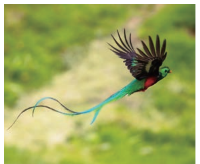
▲世界一美しい鳥といわれるケツァール

中米にあるコスタリカ。中米の中ではとても治安の良い国として知られており、神秘の森には、珍しい動植物を楽しむことができます。また、世界一美しい鳥ケツァールもこの時期、高い確率でみることができます。温泉リゾートホテルなどにも宿泊します。豊かな自然の中でのハイキングを楽しめます。