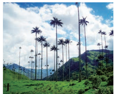
▲コロンビアの山と貴重な自然を歩く

南米の北部、太平洋とカリブ海に面したコロンビアは広大なサバナ平原、熱帯雨林、驚異的な形を見せる岩山、歴史的な建造物が残る首都ボゴタなど、驚くほど変化に富んだ姿を見せてくれます。まだまだ訪れる人が少なく、日本ではあまり知られていませんが、一度は訪れたいそんな自然が溢れています。