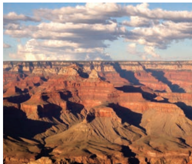
▲グランドキャニオンの絶景

アメリカ西部のグランドサークルは世界でも類を見ないほどの国立公園が集中しているエリアです。その驚異的な大自然の景観を6日間めぐり、個性的な造形美をハイキングで堪能します。有名なグランドキャニオンなど、一生に一度は訪れるべきおすすめの場所を、現地在住のツアーリーダーがご案内します。