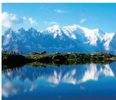
▲シェズリー湖からのモンブラン

アルプス最高峰モンブランの山麓シャモニから名峰マッターホルンの山麓ツェルマットへと歩く“オートルート(高い道)”を5泊6日で歩きます。観光客の少ない静かなアルプスの谷と峠越え、素朴な山村風景など変化に富んだトレッキングは、日本での夏山山小屋縦走程度の体力が必要な健脚向きトレッキング。