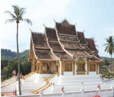
▲世界遺産都市ルアンパバーンを象徴する寺院ワット・シェントーン

ラオスは、東南アジアの中でもっとも素朴で古き良きアジアの雰囲気を感じさせる国です。日本とよく似た山岳地帯で手軽に楽しめる登頂コースや、美しい滝まで訪れるコースを歩き、世界遺産に登録されているルアンパバーンの街や自然豊かな美しい素朴な町バンビエンも魅力です。