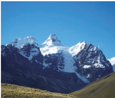
▲名峰コンドリリを望む

見渡す限り白の世界が広がるボリビアのウユニ塩湖とインカ帝国の象徴マチュピチュ遺跡、インカ帝国発祥の地といわれる太陽の島、リアル山脈の名峰コンドリリを望むハイキング、多民族国家の首都ラパス観光。アンデスを縦断しインカ帝国の歴史と遺産を垣間見るスペシャルコースです。