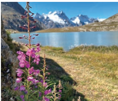
▲高山植物咲く高原をハイキング

フレンチアルプスを象徴するヴァンワーズ国立公園とグラン・パラディソ国立公園への山旅です。石灰岩の崖、高山の草原、山岳峠など、花咲くパノラマトレイルでフラワーハイキングを楽しみながら、フレンチアルプスを代表する山々の眺望を満喫。イタリアに入り、氷河によって削られた谷、広大な高山台地、グラン・コレットへの登山も楽しめます。