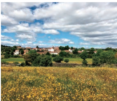
▲ポルトガルの魅力的な自然を楽しむ

ポルトガルの魅力的な自然、歴史を堪能しながらフラワーハイキングを楽しむ新企画です。ポルトガルの中央部に連なる、ポルトガル最高峰のあるエストレラ山脈、中世の魅力が残るソルテーリャ、大西洋に面した海岸線、ポルトガルの自然と素朴な村々、そこに住む人々、多様な花々を満喫するポルトガルの旅へご案内します。