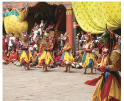
▲祭りの会場で披露される踊り

ブータン最大の祭りパロツェチュ。トンドルと呼ばれる大きな仏画が壁に掲げられるパロツェチュ最終日に会場を訪れ、ブータンの人々と祭りを楽しみます。また、チョモラーリを望むハイキングも楽しめます。素朴な国の魅力の文化や生活、ブータン、ヒマラヤなどをお楽しみください。