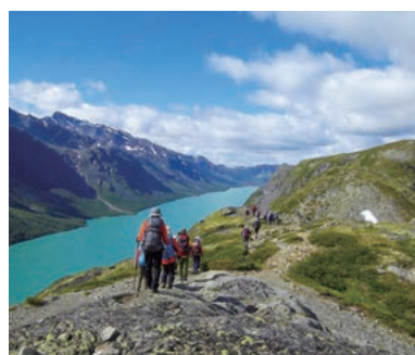
▲広い空と深いフィヨルドは北欧ならではの景観

北欧ノルウェーを代表する山岳風景を誇るヨートゥンハイメン国立公園での山小屋泊まりのトレッキングです。湖を見下ろす尾根や氷河谷、可憐な高山植物など、フィヨルド地形特有の美しさが白夜の淡い斜光の中に溶け込みます。最後は北欧最高峰ガルホピッケン(2,469m)登頂を目指します。やや健脚向きコース。