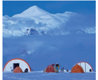
▲ローガンを間近に望む「アイスフィールド・ディスカバリー」

極地を除いて、世界最大級の大氷河を形成するローガン(5,959m)の頂上台地は、20kmに及ぶ世界最大級の山塊です。ローガンを目の前に設置したキャンプ地でスノーシュー、写真撮影などを楽しみ、山々の景色と貴重な場所での滞在を思う存分お楽しみください。