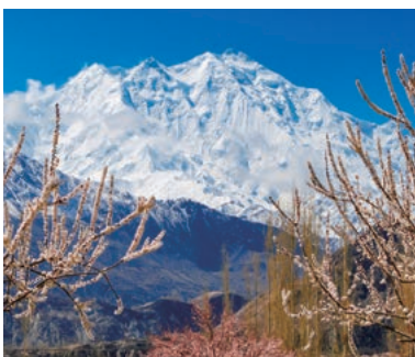
▲桃源郷フンザのアンズの花とラカボン

カラコルム山脈の真っ只中のフンザは春、氷河の名峰が果樹の花咲く美しい景観とともに楽しみ、まさに桃源郷の様相を呈します。国内線を利用し快適なホテルを起点に、のんびり滞在してのハイキングは至福の体験です。名峰を仰ぎみる5つのハイキングコースで合計11座の7,000m峰を展望することができます。