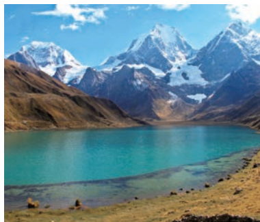
▲カルアコーチャ湖畔からのワイワッシュ山群

アンデス山脈の主脈部分であるペルーのブランカ山群とワイワッシュ山群が旅の舞台です。高所順応をはかりながらブランカ山群は日帰りハイキングを、まだまだ訪れる人の少ないワイワッシュ山群では3泊4日のトレッキングをおこなう充実の山旅です。アンデス山脈の最も見応えのある名峰・秀峰群を楽しめる充実のコースです。