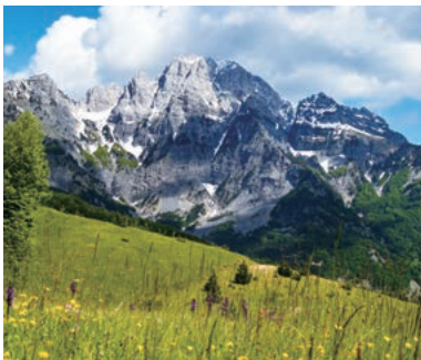
▲アルバニアの山岳地帯の絶景

バルカン半島の西側、アドリア海に面し、豊かな自然の中で雄大なトレッキングが楽しめる場所として注目を集めています。北部の山岳地帯は標高2,000mの山々が鋸の歯のように連なり、ハイキングで雄大な景色が楽しめます。1991年まで鎖国状態だったためまだまだ訪れる人も少ない、バルカン半島の宝石とも呼ばれるアルバニアの山旅です。