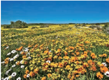
▲1年に1度だけ花の楽園となるナマクワランド

南アフリカのナマクワランド一帯の原野一面にワイルドフラワーが咲く季節限定の特別企画です。ナミビアのウォルスベイから南アフリカのケープタウンまでアフリカ大陸南西端を北から南へ約1,600kmを縦断します。荒涼としたナミビアの大地から花咲く南アフリカへと、国境越えの日の色彩の変化は圧巻です。