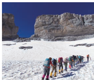
▲国境の峠、ローランの裂け目

ピレネー山脈の核心部、フランス側からスペイン側へ歩いて越える山小屋泊まりの縦走トレッキングコースです。フランスとスペインの国境にそそり立つ岩壁の裂け目ブレッシュ・ド・ローラン越えや世界遺産ガヴァルニー大圏谷でのハイキング、バルセロナ市内観光などスペインの山歩きをしっかりと楽しむ盛りだくさんの内容です。