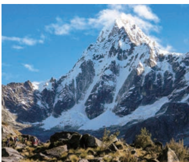
▲タウリラフ直下の峠を越える

アンデス・ブランカ山群の核心部をトレッキング。華やかなヤングスコ谷から美しいサンタクルス谷へ、アルパマヨ、キタラフ、タウリラフなどの秀峰群を眺めながらトレッキングが楽しめる贅沢な旅。美しい名峰群が毎日目の前に次々と現れます。歩き始める前には専用車を効率よく使い高所順応も行います。