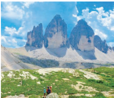
▲ドロミテを代表する岩峰ドライチンネン

ドロミテとオーストリアの2大人気山岳エリアを訪れて多彩なハイキングや散策を楽しみます。ドロミテの圧倒的な迫力の岩峰群、美しいフネス谷やカルディナ谷、オーストリア最高峰グロスグロックナー(3,798m)など見どころは満載。旅はインスブルックから始まり、締めくくりはザルツブルクと2つの古都を巡りながら歴史と文化を堪能します。