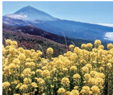
▲最高峰テイデ山と固有種テイデ・エニシダ

日本人唯一のカナリア諸島公認ガイドと大西洋に浮かぶカナリア諸島のそれぞれ違った魅力を持つ3つの島に訪れます。スペイン最高峰のテイデ山に登り、ガラホナイ国立公園で太古の森をハイキング。さらに、火山が作ったカルデラの縁もハイキングします。この時期だけに咲く花をお楽しみください。