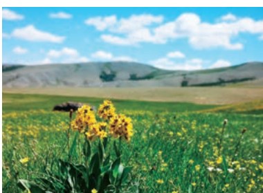
▲モンゴルの大平原でフラワーハイキング

モンゴルの広大な大地が緑色の草原となる7月、モンゴルの首都ウランバートルから西へと移動し、モンゴルの国花スカビオサをはじめ、多くの高山植物が開花する高原でフラワーハイキングを楽しめます。モンゴルの広大な草原と高山植物のお花畑、さらにモンゴルの歴史と伝統文化も感じる旅です。