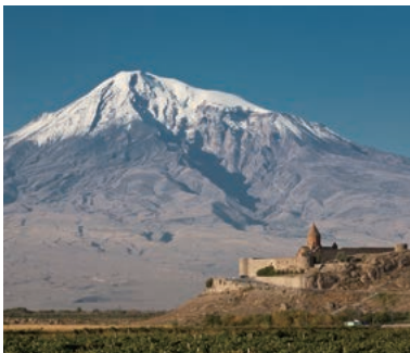
▲アララット山を望む

ヨーロッパ文化の起源の地であり、世界最古のキリスト教国アルメニア。アルメニアはアジアとヨーロッパの間にあるコーカサス山岳地帯にある山岳国です。このツアーはアルメニアの花のベストシーズンに訪れてアララット、アラガツツ2つの国の優美な最高峰を望みながらフラワーハイキングを楽しむコースです。