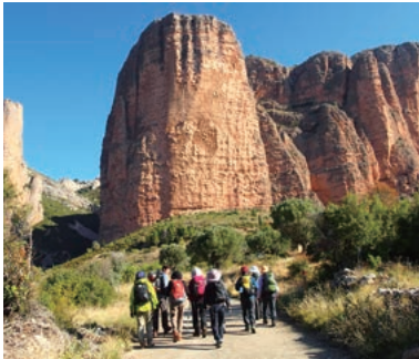
▲マージョス・リグロスの周囲をハイキング

春のベストシーズンにスペイン北部のアラゴン州へ。自然景観の中に溶け込む小さな村々、そこに生きる素朴な人々、美しい自然の中、歴史ある巡礼路ハイキングや要塞都市の訪問など、アラゴン・ピレネーの山と里を巡る旅へご案内いたします。かつての国際鉄道駅舎を改修し2023年にオープンしたカンフルンク駅舎ホテルにも宿泊します。