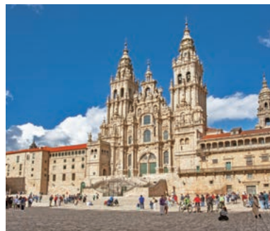
▲聖地サンティアゴ・デ・コンポステーラを目指す

数ある巡礼路の中でも一番の人気ルート。約800kmに及ぶ「フランス人の道」のハイライト部分を歩きます。フランスからピレネー山脈を越えてスペインへの聖地ガルシアまで北スペインの文化に触れながらサンティアゴ・デ・コンポステーラを目指します。大聖堂前でゴールを迎えた後はフェニステレ岬も訪れます。