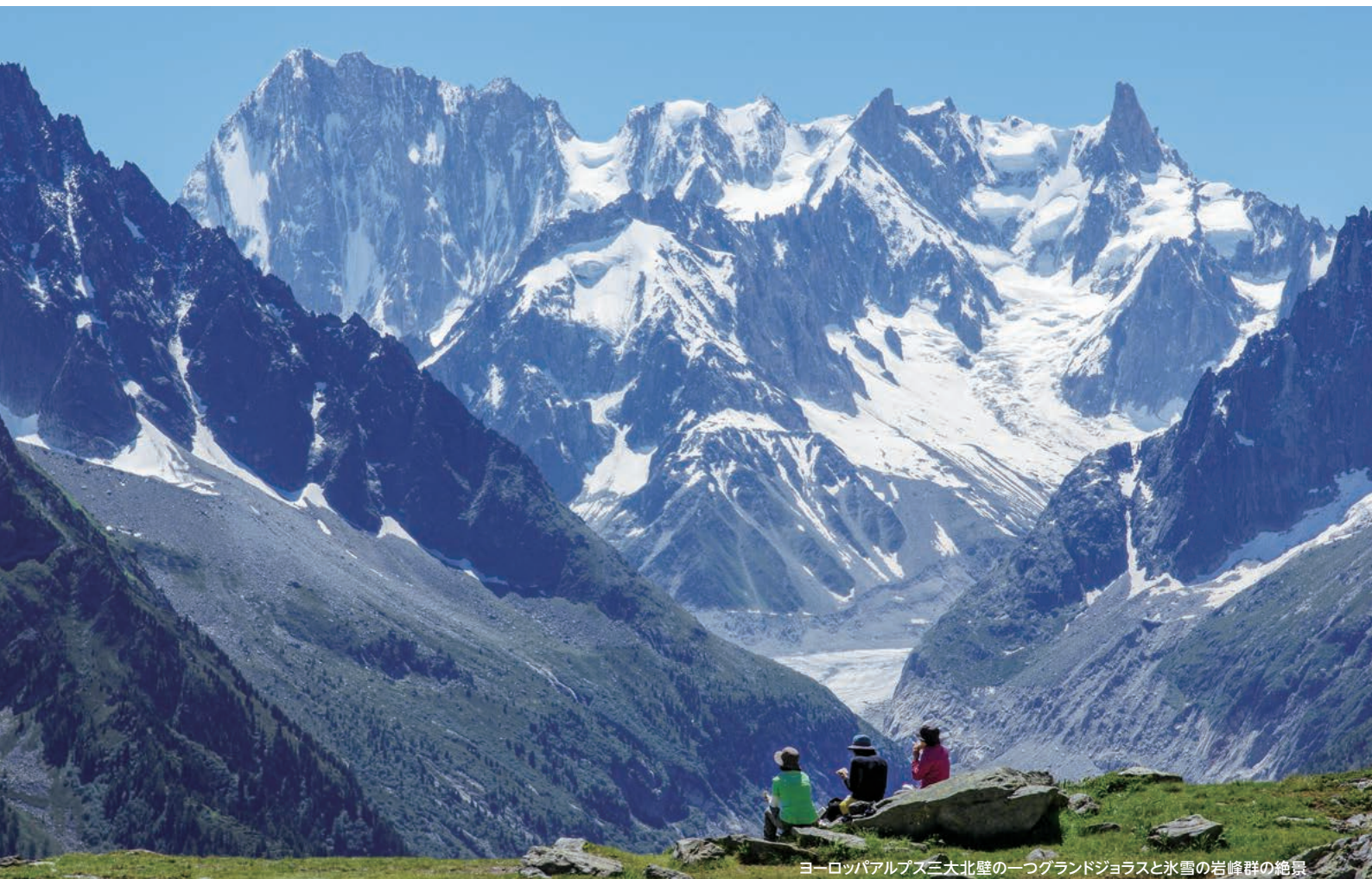
ヨーロッパアルプス三大北壁の一つグランドジョラスと氷雪の岩峰群の絶景