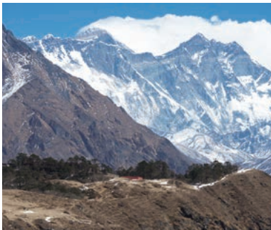
▲世界最高峰エベレスト(左)、ローツェ(右)

ヒマラヤの遠征隊で活躍する高地民族シェルパ族が生活する村々を訪ねながら、憧れの世界最高峰エベレストの展望地を目指します。比較的短い日程で、世界最高峰とそれを取りまく圧巻のヒマラヤの巨峰群を堪能でき、シェルパ族やチベット仏教の伝統と文化も感じる事が出来るトレッキングです。