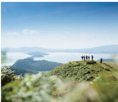
▲スコットランド屈指の絶景をハイキング

スコットランド屈指の絶景ローモンド湖国立公園の山々と渓谷をトレッキング。古城・野生動物をテーマにしたクルーズや、ハイランドの蒸留所を見学し試飲などお楽しみいただけます。ユネスコ世界遺産の美しい街並みと歴史に彩られたエディンバラの市街の散策など、スコットランドの豊かな自然・文化・味を余すところなくお楽しみください。