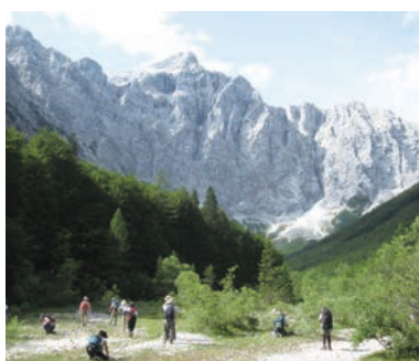
▲スロベニア最高峰トリグラウ

トリグラウ国立公園はスロベニアで唯一の国立公園で、標高が高く石灰岩質のため個々独自の進化を遂げた可憐な花々が花を咲かせます。このコースでは高山帯の牧草地から稜線にある山小屋に泊まり、スロベニア最高峰トリグラウの山岳展望、点在する山上湖の変化に富んだ景観を楽しみながら、花咲く高山帯での縦走を満喫します。