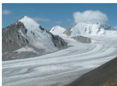
▲モンゴル最高峰フティンを望む

モンゴルの首都ウランバートルから国内線で約4時間。さらに車で大草原を走りモンゴルの西端へ。穏やかな山容のモンゴル最高峰・フティン(4,374m)の他、氷河をいだいたタバンボクド山群を目指します。フティン山展望やタバンボクド山群のベースキャンプへのトレッキング、氷河の展望地までのトレッキングなど、大パノラマの展望を楽しめます。