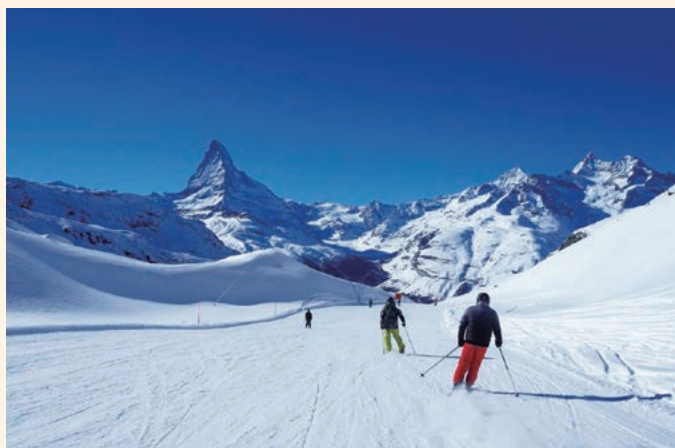
▲マッターホルンを正面に見ながら滑走を楽しむ

世界中からスキーヤーが集まる、憧れのスキーリゾート・ツェルマットに滞在して4日間のスキー滑走を楽しめます。マッターホルンをはじめ4,000m級のアルプスに囲まれた迫力ある景色や、シーズンを通して安定した抜群の雪質、イタリア側へのロング滑走など、たくさんの魅力が詰まった人気も満足度もNo.1のリゾートです。はじめての海外スキーにも、リピーターにもおすすめです。