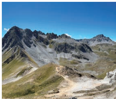
▲フレンチアルプスの山岳風景を堪能

フレンチアルプスの3つの国立公園を巡り、氷河、天を突く鋭い岩峰、そそり立つ岩壁、広大な高地高原、そして静かな山上湖を巡るパノラマハイキングの旅です。昔ながらの素朴な雰囲気のある村々や、野生動物との出会いも楽しみ。フランスとイタリアの国境をまたぎ、変化に富んだ景観と壮大な山岳風景をたっぷり満喫する山旅です。