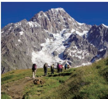
▲モンブラン南壁を正面に望む

4つの峠を越えて、5つの谷を結ぶ、大人気のツール・ド・モンブラン・トレッキングへご案内します。フランス、イタリア、スイスをめぐり、峠から峠へと高度差400mから1,500mを登降する健脚向きのコースです。迫力の氷河、お花畑、雄大な名峰など変化に富む景観をお楽しみください。