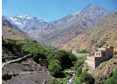
▲北アフリカ最高峰のツブカル山

アフリカ大陸北西部に連なるアトラス山脈の最高峰にして北アフリカ最高峰のツブカル山(4,167m)の登頂を目指します。1,740mから登山開始標高3,207mの山小屋に宿泊し2泊3日の行程で山頂を往復します。標高は4,000mを越えませんが特別な登山技術は不要です。遊牧民が作った世界遺産の街マラケシュも探訪する、エキゾチックなモロッコの旅です。