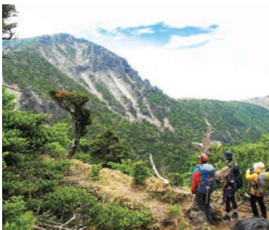
▲漢拏山の荒々しい岩壁を望む

韓国を代表する2座を効率よく一度に登るコースです。山旅の前半は、広大な山域をもち、奥深い登山を楽しむ事の出来る智異山を山小屋泊まりの1泊2日の行程で登ります。旅の後半は、空路で済州島へ移動し、韓国最高峰の漢拏山に登ります。9～10時間をかけて上り下りする歩きごたえのある山です。