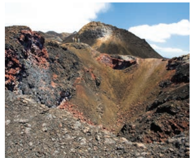
▲荒々しい姿のガラパゴス・イザベラ島

エクアドルは赤道直下の南米の太平洋に面し、アマゾンのジャングル、アンデスの山々、ダーウィンの進化論の舞台となったガラパゴスなど自然の魅力が溢れるところです。エクアドル・アンデスをハイキングした後、ガラパゴス諸島に上陸して滞在。貴重な自然をハイキングで楽しむ特別な企画です。