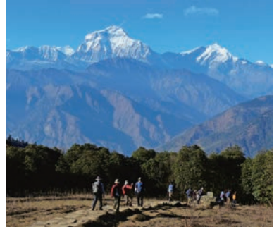
▲ダウラギリI峰(左/8,167m)トゥクチュピーク(右/6,920m)

ヒマラヤを代表する山々を一望できる人気のコースです。8,000m峰を擁するアンナプルナ山群とダウラギリ山群を同時に見渡すことの出来るプーンヒルを目指して、トレッキングを楽しめます。高山病の心配も少ないため、ヒマラヤトレッキングが初めての方にもお勧めのコースです。春の季節は咲き誇るシャクナゲも楽しみです。