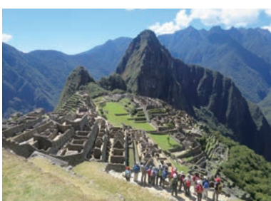
▲インカトレイルを歩きマチュピチュ遺跡を目指す

高所順応に配慮した日程で、世界遺産のマチュピチュへと続く憧れのインカの古道を、3泊4日のトレッキング。コース上には数々の遺跡が点在し、インカ時代に造られた石畳を歩きマチュピチュ遺跡を目指します。インカの遺跡群、サルカントイやペロニカなどアンデスの山々を望みます。古都クスコも訪れます。