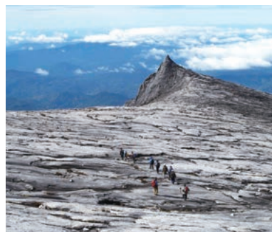
▲登頂後、広大な頂上台地を下る

赤道直下の南シナ海に浮かぶ世界で3番目に大きなボルネオ島は、熱帯雨林から標高4,095mのキナバル山まで多彩な自然が存在しています。峻険な岩峰を空に突き上げるマレーシア最高峰キナバルは日本から最短距離でアプローチできる4,000m峰で、初めての海外登山にお勧めの山です。美しいビーチも満喫!