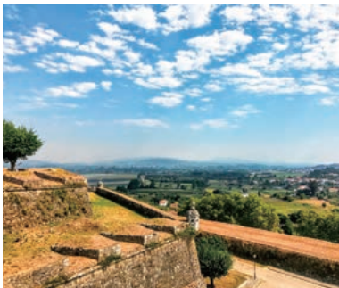
▲素朴なポルトガル北部の道を辿る

ポルトガルの北部、世界遺産にも登録された古都ポルトからサンティアゴ・デ・コンポステーラを結ぶ巡礼の道。大西洋に沿って美しくも険しい海岸線や伝統的な生活が続く古い村々、歴史的な建造物など、ポルトガル北部の魅力を堪能しながら聖地を目指します。まだ日本ではあまり知られていない「ポルトガルの道」を歩きます。