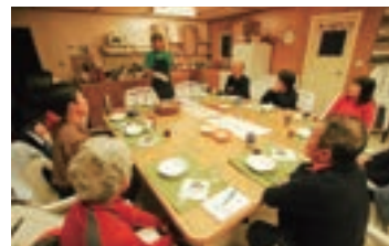
▲おいしい!と大好評のお食事風景