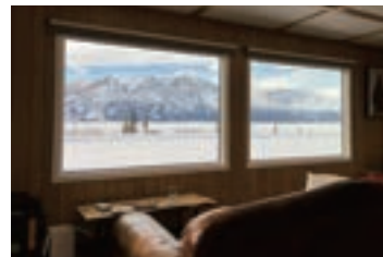
▲ダイニングの外には絶景が広がる