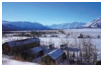
▲広大な大自然の中に佇むクアアニ・ロッジ