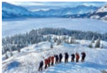
▲日中は雄大な景色の中をスノーシューハイキング