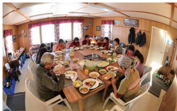
▲専属コック手作りの食事が大好評