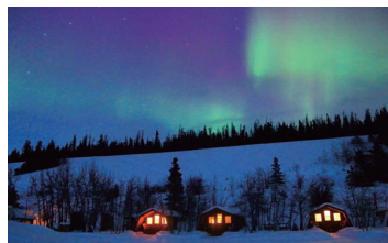
▲オーロラ観賞には抜群のロケーション

世界遺産のクア二国立公園に隣接するロッジに連泊するアルパインツアーオリジナル企画です。ロッジの目の前には結氷した湖が広がり、正面を遮るものが無いため、オーロラ観賞には抜群のロケーションです。ダイニングとリビング、バスルームのあるメインロッジと宿泊用のキャビンがあり、キャビンの外へ一歩出ればすぐにオーロラ観賞ができます。また、夕食はとても好評で、お食事を楽しみながらオーロラの出現を待ちます。防寒着の無料レンタルがあります。