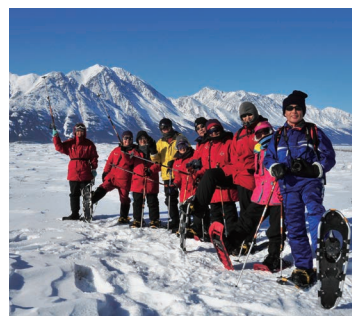
▲日中はスノーシューハイキングを楽しむ