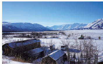
▲遮る物のないクルアニ湖畔に建つロッジ