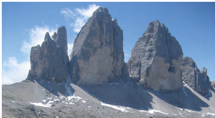
▲ドロミテの名峰ドライ・チンネン(イタリア語ではトレ・チメ・ディ・ラヴァレード)

数あるドロミテの岩峰の中でも特に代表的な岩峰と言われるのが、ドライ・チンネンです。そびえ立つ大岩峰の裾野を、高原台地や山小屋をめぐって岩峰群を一周します。また、これらのエリアは知られざる高山植物の大群落地です。色とりどりのお花が目を楽しませてくれることでしょう。