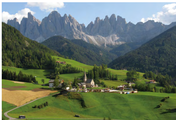
▲絵のように美しいフネス谷/ガイスラー山群(奥)とマッダレーナ村(手前)