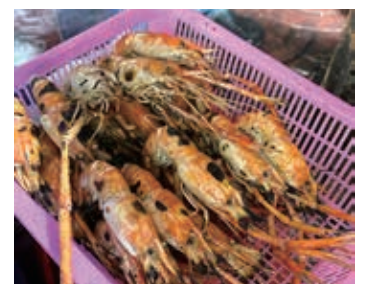
▲美味しい海鮮料理

ハロン湾は、1994年に世界遺産に登録。約1500㎡の広大な湾内に約2,000もの大小の岩島が点在します。そのため、多くの魚介類が生息しています。カットバー島では、海鮮料理を堪能します。