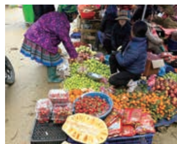
▲活気溢れる少数民族の市場

サバ周辺は、多くの山岳少数民族が住んでいます。この旅では、花モン族や黒モン族などの集落を訪れます。少数民族の文化や生活に触れながら、活気溢れる市場などを楽しみましょう。