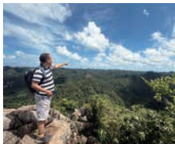
▲グーラム山山頂を目指す

グーラム山の山頂からは、島全体が見渡せる絶景が広がります。山麓は、植生豊かな原生林に覆われ、保護区にもなっています。ハロン湾でとれた新鮮なシーフードも魅力的です。