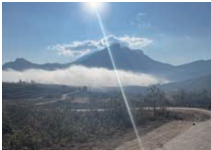
▲ラオタン山を望む

ベトナム北部にあるラオタン山(Lao Than)は、ベトナム北部のラオカイ省バットサット県イティ村に位置する標高2,860mの山です。別名「イティの屋根」や「雲狩りの楽園」とも呼ばれ、雲海の名所として知られています。10～12月、3～4月が特に美しい景色を楽しめるベストシーズンです。また、1920年から1927年のフランス植民地時代に建設されたパビ古道も魅力です。