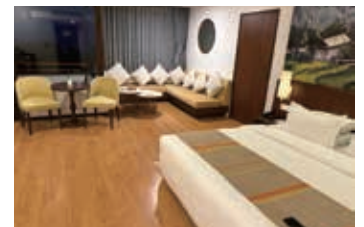
▲ラグジュアリーな部屋

ポカラの街の上部にあるサランコットの丘にある5つ星ホテルです。ホテルからは、マチャブチャレやアンナプルナ山群を望むことができます。ヘリもお庭から離陸します。