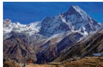
▲アンナプルナBCより望むマチャブチャレ(6,993m)

アンナプルナの核心部へは、歩くなど往復で10日間ほどかかりますが、ヘリをチャーターし、ホテルから一気にアンナプルナベースキャンプに飛ぶ究極コースです。