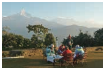
▲ロッジ前の専用庭での贅沢な朝食

部屋にはシャワーやトイレ、ベッドなどが完備されており、専用のお庭や広々とした食堂、夕方のハイ下午茶のドリンクサービスなど、充実したサービスです。