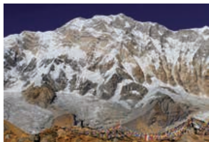
▲標高差約4,000mの迫力で仰ぎ見るアンナプルナ南壁の雄姿

今回訪れるアンナプルナ山群は、多くの名峰が密集している山群です。このコースでは世界で最初に登られた8,000m峰でもあるアンナプルナI峰をはじめ、アンナプルナII～V峰、マチャブチャレ、アンナプルナサウスなど多くの雪山を望むことができます。また、ネパールの人々の生活道を歩くため、ネパールの暮らしや文化などにも触れあうことができるコースです。