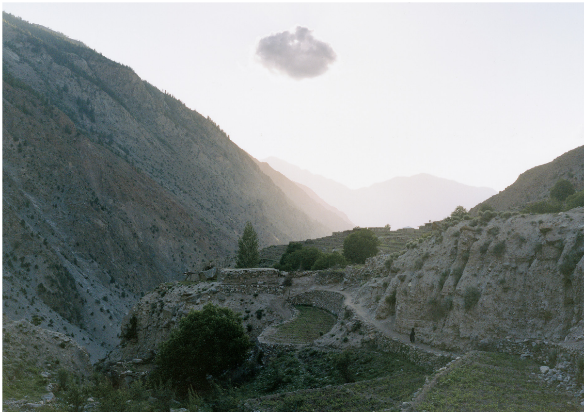
遠く辺境地の奥へと進む