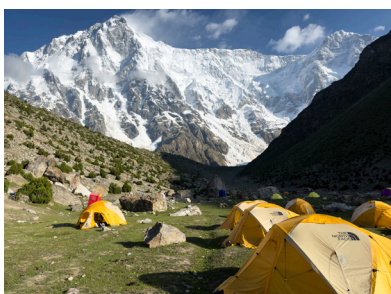
ポーランドBCからのナンガバルバット