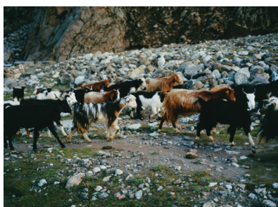
山麓では、ヤギが草を食んでいる