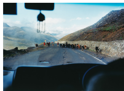
車道を牛たちがふさぐ