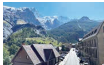
▲ラ・メイジュ(3,983m)を望む

【日程】①夕刻、東京発→欧州・中東經由都市 ②→ジュネーブ ③→ ヴィラルル・ダレーヌ ④→ エンバリ高原ハイキング ⑤→ エ克蘭国立公園ハイキング ⑥→ ラ・メイジュ展望ハイキング ⑦→ ヴァノワーズ山群展望ハイキング ⑧→ プチ・モン・プラン登頂 ⑨→ ヴァノワーズ峠ハイキング ⑩→ グラン・パラディーズ展望ハイキング ⑪→ジュネーブ→欧州・中東經由都市 ⑫→東京着