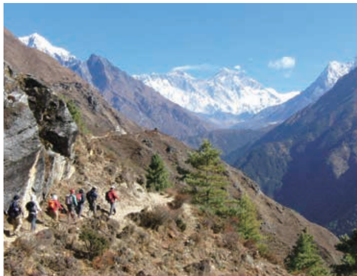
▲エベレスト (中央奥) を正面にエベレスト街道をトレッキング

平均的なロッジに宿泊します。トレッキング中はロッジ提供の食事が主体となりますが、専属コックが同行し単調にならないようお手伝いします。