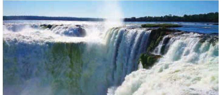
▲イグアスの滝も訪れます