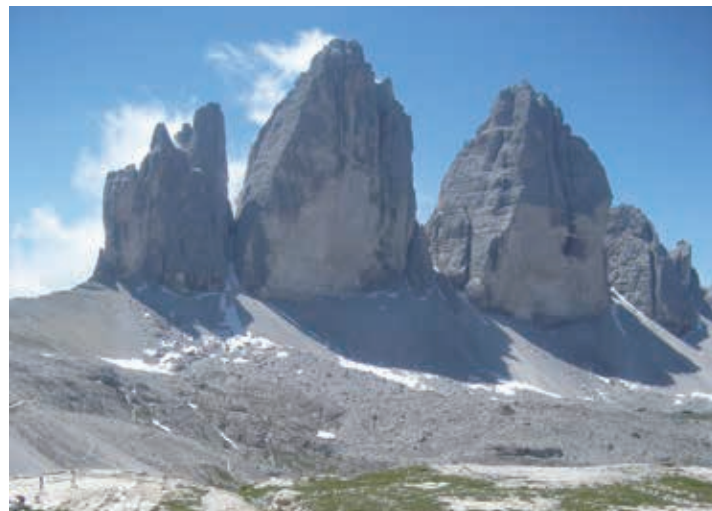
▲ドロミテの名峰ドライ・チンネン(イタリア語ではトレ・チメ・ディ・ラヴァレード)

【日程】①東京発→欧州・中東経由都市へ ②→ミュンヘンへ ③インスブルック旧市街を散策 ④ドロミテ山群へ ⑤フネス谷を散策 ⑥ガルデナ谷のオルテセイへ ⑦セツラ峠小屋へ ⑧サツ・ベツェル小屋往復ハイキング ⑨3つの岩峰ドライ・チンネンを一周ハイキング ⑩ハイリゲンブルートへ ⑪フランツ・ヨゼフス・ハーエへ ⑫グロースグロックナーとパステルツェ氷河ハイキング ⑬音楽の都ザルツブルクへ ⑭ザルツブルク市内観光 ⑮ミュンヘン発→欧州・中東経由都市へ ⑯→東京着