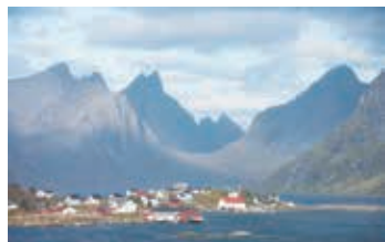
▲急峻な岩山が聳えるロフォーテン

セニア島の東側の気候は比較的穏やかで緑豊かな大地が広がりますが、島の西側は切り立つ岩峰とフィヨルドの景観が特徴で、秋の季節には特徴的な景観が錦秋に染まる絶景が楽しめます。