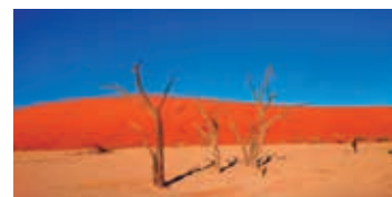
▲ナミブ砂漠最奥のデッド・フレイ

【日程】①午後、東京発→東南アジア經由→アジアババ ②→ウォルズベイ ③ セスリエム ④ ナミブ砂漠 ⑤ カラハリ砂漠 ⑥ スプリングボック ⑦ ナマクワ国立公園 ⑧ ハンタム国立公園 ⑨ ウエストコースト国立公園 ⑩ テーブルマウンテン ケープポイント ⑪ ビクトリアフォールズ サンセットクルーズ ⑫ ビクトリアフォールズ散策 →アジアババ→東南アジア内經由 ⑬→東京着