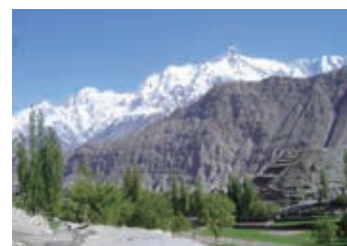
▲ホーパル村からのウルタルII峰 (7,388m)