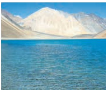
▲神秘的な雲囲いのパンゴンツォ