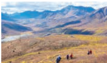
▲ユーコンを代表する展望ハイキング

北緯64度を越えた先に位置するのがトゥームストーン準州立公園。秋になると広大なツンドラの大地を埋め尽くすほどの紅葉・黄葉に染まり、絶景のハイキングが楽しめます。