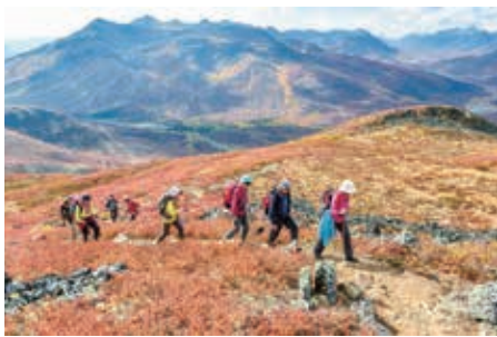
▲トゥームストーン準州立公園は旅のハイライト

秋の極北ユーコンを舞台に、ロマン溢れる冒険の旅に出発しましょう。カナダの北西部に位置し、日本の1.3倍の面積を誇るユーコン準州は、タイガとツンドラ地帯からなる広大な大地です。雄大な自然には野生動物たちが暮らし、厳しくも美しい世界を今に残しています。北緯64度を越えた先に位置するトゥームストーン準州立公園はこの旅のハイライト。冬季の気温はマイナス30度を下回る日も多いツンドラの世界は、まさにここにしかない特異な自然美を作り出しており、訪れる誰もが驚き、魅了されます。準州都のホワイトホースやドーソンシティは約130年前のゴールドラッシュの時代に栄え、今でもその当時の名残りを色濃く残しています。