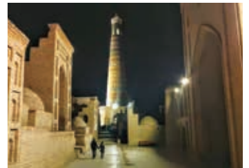
▲ヒヴァのイチャンカラ場内