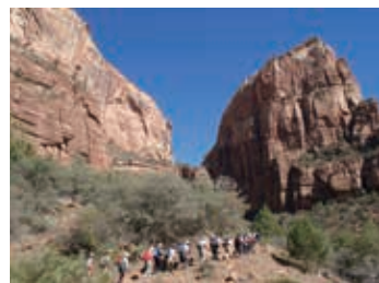
▲ 美しい渓谷ザイオン

深い渓谷と巨大な岩壁が特徴的なザイオンは「神々の国」という意味があります。まさに神々が住むにふさわしいような絶景が満喫できる、アメリカでも人気の国立公園です。