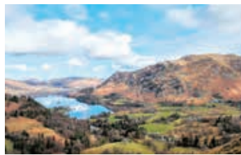
▲3つの国立公園で変化に富んだ景観を堪能

【日程】①夕刻、東京発→欧州・中東經由都市 ②→マンチェスター ホワイトヘブン ③ セント・ビーズ岬 ④ エナーデル湖畔 ⑤ ダブ・コテージ ⑥ ヨークシャー・デイルズ国立公園 ⑦ ペナイン山脈 ⑧ ノース・ヨーク・ムーア国立公園 ⑨ グレイステール村 蒸気機関車でゴースランドへ。 ロビンフッズベイ ⑩ マンチェスター→欧州・中東經由都市 ⑪→東京着