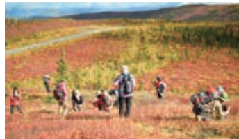
▲ハイウェイを見渡す気持ちの良い尾根

赤や黄色に染まるユーコンの大地を見ながらトップオブザワールド・ハイウェイを走り、展望の素晴らしい場所で車を停めて気持ちの良いハイキングを満喫します。