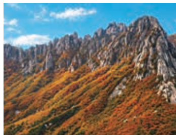
▲紅葉が山肌を彩る雪岳山

峨嵯山(アチャサン)は漢江(ハンガン)とソウル市街を見渡せる名所で、歩きやすい登山道を登ると、360度広がるパノラマ風景を楽しむことができ、空見にはうってつけの山です。