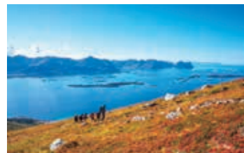
▲青い海と錦秋のコントラストが美しいセニア島

北緯66度33分以上を北極圏と呼んでいますが、ロフォーテン諸島とセニア島はこの北極圏に位置しています。この地域は9月ともなると、夜、オーロラ観賞を楽しむチャンスがあります。