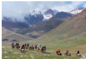
▲圧倒的なスケールの山岳地帯を進む