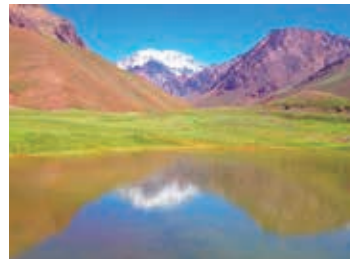
▲アメリカ大陸最高峰のアコンカグア南壁

南・北両アメリカ大陸の最高峰アコンカグア (6,960m) はチリとの国境に近いアルゼンチン領内にそびえる巨大な山です。アコンカグアの南壁は世界の代表的な氷壁のひとつに数えられています。