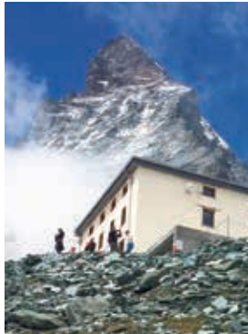
▲ヘルンリ小屋から見る大迫力のマッターホルン

世界中の人々を魅了するスイスの名峰マッターホルン(4,478m)。天高く聳えるその頂を目指すクライマーたちがアタック前日に宿泊するのが標高3,260mに建つヘルンリ小屋です。この特別な山小屋に宿泊しクライマーの雰囲気と巨大なマッターホルンの迫力を感じてみましょう! 登り出し地点まで行き本物のマッターホルンに触れることもできますので、忘れられない貴重な体験となるでしょう。対照的にロープホルン小屋は素朴で家庭的な温かい雰囲気の山小屋です。