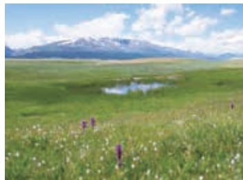
▲少し街を外れると広大な大自然が広がる

【日程】①午後、東京発→ウランバートル ② ホスタイ・フラワーハイキング 。ステップ森林地帯で動植物の観察 ③ 文化遺産が集中するオルホン渓谷やエルセン・タサルハイやホグノ・ハーン山麓でフラワーウォッチング ④ カンガイ高原でフラワーハイキング ⑤ ウギー湖湖畔ウォーキング ⑥ 大草原を一路ウランバートルへ ⑦ 終日、ウランバートル市内観光 ⑧→東京着