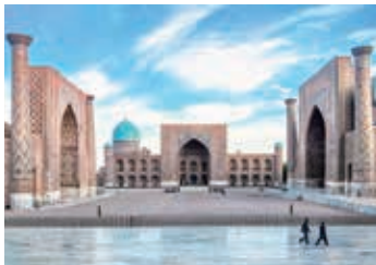
▲サマルカンドのレジスタン広場

ウズベキスタンから国境を越えタジキスタン・シルクロードの新世界遺産『ザラフシャン＝カラクム回廊』を進み、ファン山脈の神秘的湖群を車とハイキングで訪問します。