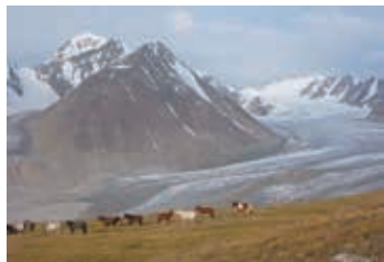
▲アルタイ山脈の大地と圧倒的な山岳景観

【日程】①午後、東京発→ウランバートル ②→ウルギー ③→ ナイルムダルの丘ハイキング ④→ツェンゲル ⑤→ モンゴル・アルタイの岩絵群 ツァガンゴル ⑥→ タウン・ボグド・ベースキャンプ ⑦→ ボターニン氷河トレッキング ⑧→ ツァガンゴル ⑨→ 遊牧民カザフ族居住地訪問 ⑩→ウルギー。カザフ民俗の演奏鑑賞。⑪→ウランバートル。午後、自由行動。夜、 モンゴル伝統芸能鑑賞 ⑫→ウランバートル市内観光。モンゴル文化体験 ⑬→東京着