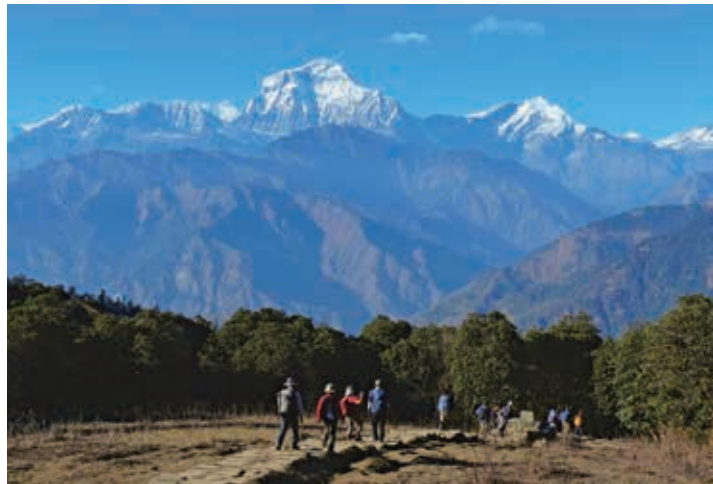
▲ダウラギリ峰 (左/8,167m) トクチェピーク (右/6,920m) を正面にデウラリ峠よりゴラバニへと下る (5日目)

平均的なロッジに宿泊します。トレッキング中はロッジ提供の食事が主体となりますが、専属コックが同行し単調にならないようお手伝いします。