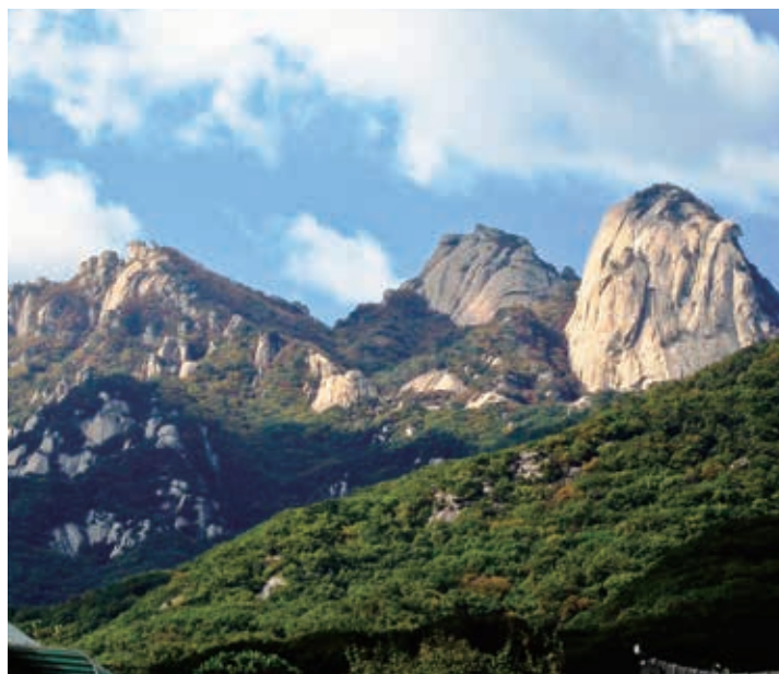
▲花崗岩の岩峰が特徴的な北漢山

※最少催行人数に満たない場合でも、ツアーリーダーは同行しませんが、5名様から現地日本語ガイドの案内で実施いたします。