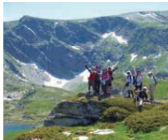
▲花咲くリラ七湖ハイキング