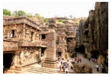
▲驚異のカイラーサナータ寺院