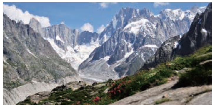
▲ グランドジョラス北壁とメールドグラス氷河

※天候・残雪によっては、コースを変更して代替ルートやエスケープ・ルートをとったり、コースの一部を割愛・省略することがあります。こちらの決定に際してはツアーリーダー及び現地ガイドの判断と指示に従っていただきますようお願いを申し上げます。