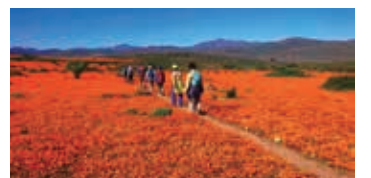
▲ナマクワデジューのオレンジがまぶしい