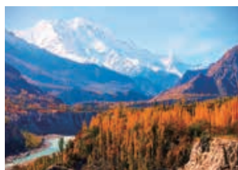
▲秋のフンザの谷とラカポシ (7,788m)

カラコルムの山々は車で間近まで迫れることが驚きです。豪快なスケールの山岳地帯にオアシスを築いた村々から、パス-氷河やブアルタル氷河など迫力あるコースをハイキングします。