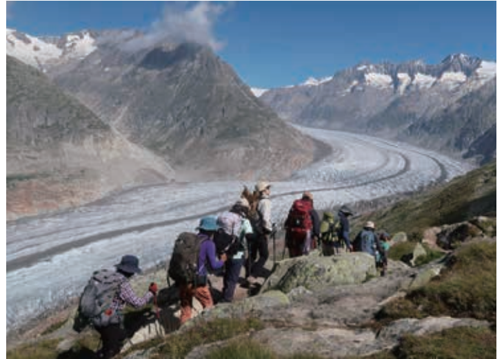
▲ 壮大なアレッチ氷河を眺めながらハイキング

※積雪、残雪の状況によっては、ツアーリーダーが別のハイキングコースへご案内いたします。 ※予定のハイキングコースは天候との条件により変更される場合があります。従登山電車代、ロープウェイ代などは旅行代金に含まれておりません。(総額の目安は約17,300円です。)