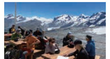
▲ヘルンリ小屋のテラスからの壮大な景色

ヘルンリ小屋のテラスからは眼前に迫るマッターホルンをはじめヴァリス山群の壮大な姿が堪能できます。ヘルンリ小屋に泊まればその大パノラマを満喫して下さい。