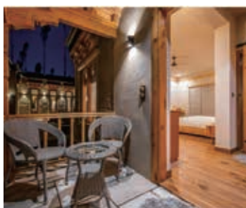
▲レーやアグラでは快適なラグジュアリーホテルに宿泊