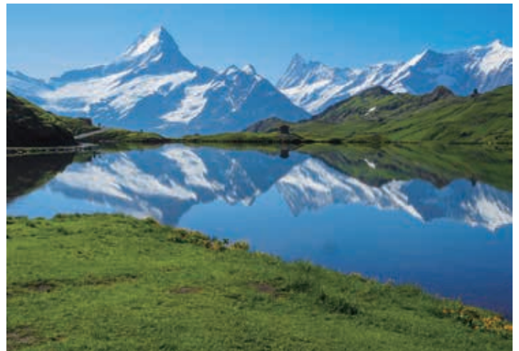
▲「アルプスの宝石」といわれるパッハアルプゼー

※積雪・残雪の状況によっては、ツアーリーダーが別のハイキングコースへご案内いたします。 ※予定のハイキングコースは天候との条件により変更される場合があります。登山電車代、ロープウェイ代などは旅行代金に含まれておりません。(総額の目安は約27,000円です。)