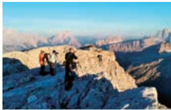
▲ラガツォイ小屋からの抜群の展望