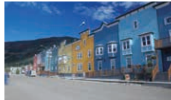
▲カラフルなドーソンの町並み

約130年前のゴールドラッシュの時代に栄えた面影が残り、その時代の史跡も多く残ります。ドーソンシティにはゆったりと4連泊して、夜はオーロラチャンスもあります。