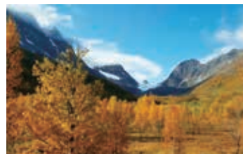
▲氷河が作り出した絶景をハイキング