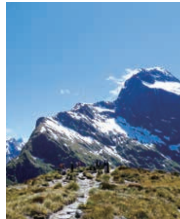
▲氷河が作った岩峰群を満喫

【日程】①夕刻、東京発→ニュージーランドへ ②オークランド→クイーンズタウン着/泊 ③✖️後ミルフォードトラック1日目→グレイドハウス泊 ④✖️後2日目→ポンポロナ・ロッジ泊 ⑤✖️後3日目→クインティン・ロッジ泊 ⑥✖️後4日目→ミルフォード・サウンド泊 ⑦✖️後ミルフォード・サウンドクルーズ✖️テアノウ着/泊 ⑧✖️後ルートバーン・トラック1日目→マッケンジー・ロッジ泊 ⑨✖️後2日目→ルートバーン・フォールズロッジ泊 ⑩✖️後3日目→トレイルエンド✖️クイーンズタウン着/泊 ⑪✖️後マウントクックまたはトワイゼル着/泊 ⑫✖️後マウントクック展望ハイキング ⑬✖️後テカポ✖️クライストチャーチ着/泊 ⑭→オークランド→東京