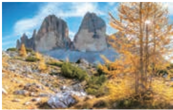
▲秋のドライ・チンネンを歩く

【日程】①夕刻、東京発→欧州・中東經由都市 ②→ベネチア コルチナ ③ チンクエトリ展望ハイキング ④ 名峰ドライ・チンネン一周ハイキング ⑤ ラガツォイ小屋ハイキング ⑥ プラロンジャ高原ハイキング ⑦ プエズ小屋ハイキング ⑧ セチューダ山群ハイキングとシウジ高原ハイキング ⑨ ベネチア→欧州・中東經由都市 ⑩→東京着