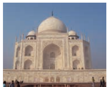
▲世界遺産タージマハル