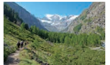
▲変化に富んだグランパラディーズ国立公園