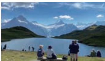
▲山上湖バッハアルプゼー

アルプスの宝石とも呼ばれる山上湖のバッハアルプゼー。グリンデルワルトの山々を鏡のように湖面に映し、穏やかに絶景が楽しめる人気のポイントです。