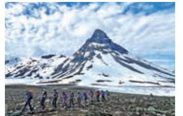
▲北欧屈指の山岳風景を誇るヨースタール国立公園