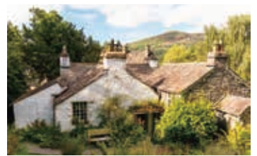
▲ワーズワースの家「ダウ・コテージ」