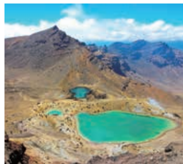
▲ダイナミックな景観のトンガリロクロッシング

【日程】①夕刻、東京発→ニュージーランドへ ②オークランド→クィーンズタウン着/泊 ③▲ タ リマカプル山ハイキング ④▲ タ ルートバーン・トラック1日目→マッケンジー・ロッジ泊 ⑤▲ タ ルートバーン・トラック2日目→ルートバーン・フォールズロッジ泊 ⑥▲ タ ルートバーン・トラック3日目→トレイルエンド▲クィーンズタウン着/泊 ⑦→オークランド▲トンガリロ ⑧▲ タ トンガリロ・クロッシング ⑨▲ タ トルア▲オークランド ⑩→東京