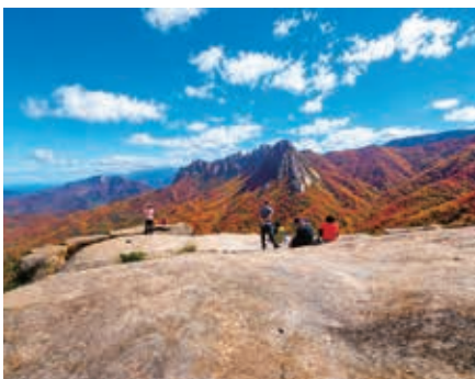
▲神仙台コースから見た雪岳山

韓国東海岸にある東草(ソクチョ)と首都ソウルにそれぞれ2泊。のんびり連泊しながら峨々たる山容と紅葉が美しい韓国の名峰・雪岳山と、ソウル近郊の手軽に楽しめるアチャ山を訪れて、ベストシーズンを迎える紅葉の展望ハイイクと軽登山で空見ハイキングを楽しみます。猪熊隆之さんと韓国屈指の山岳美を誇る雪岳山とソウル近郊の山で、豊かな自然の魅力に迫ります。美味しい韓国料理もお楽しみいただけます。