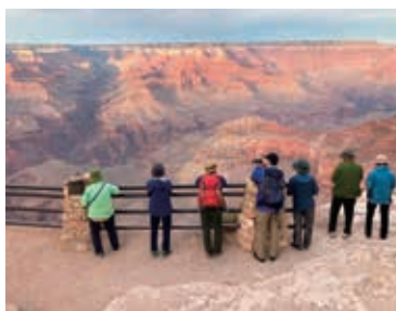
▲ 壮大なグランドキャニオン

アメリカ西部の国立公園の代名詞ともいえるグランドサークルを、9日間の日程で4つの国立公園と1つの特別保護区を巡り、余すところなくお楽しみいただけます。緑豊かな渓谷や、西部劇の舞台となったピュート(残丘)、世界最大の峡谷。それぞれ一つとして他と同じ印象を受ける場所はありません。