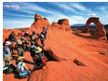
▲ ユタ州のシンボルデリケートアーチ

雨と風が長い時間をかけ、砂岩の大地を削り出来たアーチ状の岩が、不思議な光景を見せてくれます。その姿は千差万別で、まさに大自然が創り出した岩の芸術品です。