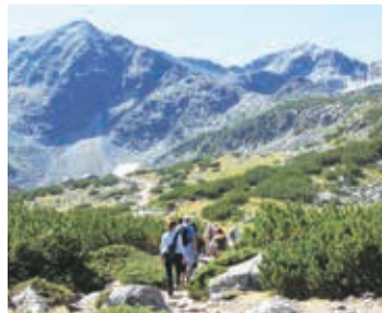
▲ムサラ(右奥)を目指し低木帯を歩く

【日程】①夕刻、東京発→イスタンブール ②→ソフィアへ。市内観光 ③ ムサラ山ハイキング ④ リラ湖群ハイキング ⑤ ムサラ山最高峰ムサラ山登頂 ⑥ リラの僧院観光 ⑦ ビフレン山登頂 ⑧ 小さな村のハイキング ⑨ プロブディフ観光 ソフィア→イスタンブール ⑩→東京着