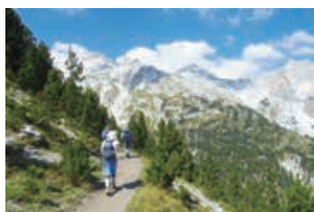
▲アルバニア・アルプスの絶景を眺めながらのトレッキング

【日程】①夕刻、東京発→欧州・中東經由都市→ティラナ ②→ 世界遺産の街ペラト観光 ③→ スラピ滝ハイキング ④→ ヴァユシャ山登頂 ⑤→ 国境越え古道ハイキング ⑥→ プロソロピ峠ハイキング ⑦→ クンジ・イ・ラガミト山登頂 ⑧→ フェルザ ⑨→ コマン湖フィヨルド観光 ⑩→ティラナ ⑪→欧州・中東經由都市 ⑫→東京着