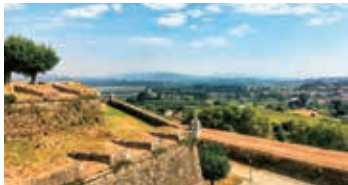
▲国境を越えてスペイン・ガリシアへ

【日程】①夕刻、東京発→欧州・中東経由都市へ ②→ポルトへ。ポルト泊 ③巡礼路1日目/ラブルージュ→ヴィラ・ド・コンデ ④巡礼路2日目/カミーニャ ⑤巡礼路3日目/ポンテベドラ ⑥巡礼路4日目/パドロン ⑦巡礼路5日目/サンティアゴ・デ・コンポステーラ ⑧ポルト→欧州・中東経由都市 ⑨→東京着