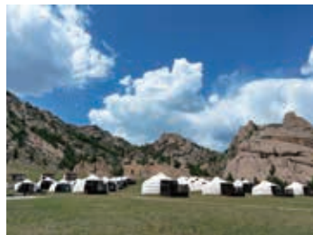
▲モンゴルの伝統的なゲルに宿泊