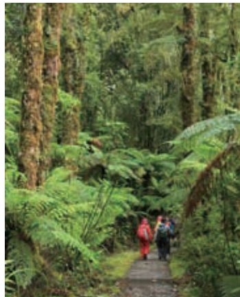
▲ミルフォードの美しい原生林

※ビジネスクラス、プレミアム・エコノミーをご希望の方はお問い合わせください。 ※ロッジには、温水シャワー、乾燥室あり。 ※ロッジでの宿泊は男女別相部屋になります。