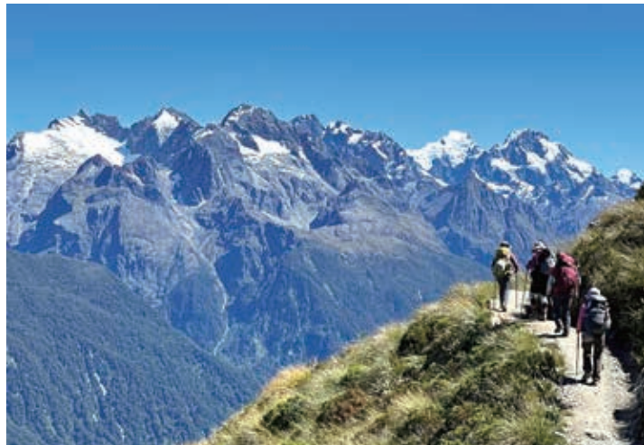
▲山岳展望を楽しむルートバーン・トラック

※ビジネスクラス、プレミアム・エコノミーをご希望の方はお問い合わせください。 ※ロッジには温水シャワー、乾燥室あり ※ロッジでの宿泊は男女別相部屋になります。