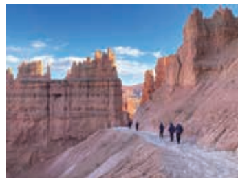
▲ 圧巻のプライスカニオン

ユタ州の南部にあり、自然が作り上げた景観が有名です。そびえ立つ尖塔群の谷底や高台の展望台から、自然の色彩あふれた美しい光景をハイキングで楽しめます。