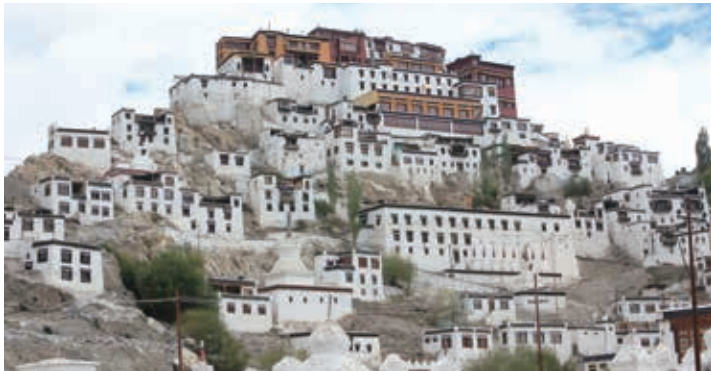
▲チベットのポタラ宮をおもわせるティクセ・ゴンパ

パンゴンツォは中国チベット自治区とインド国境にまたがるアジア最大級の高山汽水湖です。全長は約150kmあり、面積の3分の2は中国チベット自治区、3分の1はインド領内に属し、インド側は塩分濃度が濃く、チベット側は淡水に近く、場所によって水の成分は違います。地元の言葉でパンとは草、ゴンとは塊、ツォは湖の意味をなし、太古の昔には豊かな草原があった可能性が伝えられています。標高4,250mの高地にあり、真っ青な空と赤茶けた岩山をバックに、まさに紺碧の湖と言われる風景が広がります。