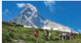
▲マッターホルン北壁直下へ