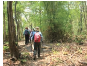
▲ラオスの大自然を歩く

日本の本州とほぼ同じ面積をもち、ニューヨークタイムズで行きたい国世界第一位に選ばれたラオス。東南アジアの中で、一番素朴で古き良きアジアの雰囲気を感じる国です。ラオスは海と接しない内陸国で、国土の多くが山岳地帯で占められています。メコン川はラオスを貫いて流れており、ミャンマーとタイとの国境をなしています。そして、なんといってもラオス人の穏やかさと優しさに出会えることが一番の魅力でしょう。日本とも関係が非常に深く、1970年代に日本の協力で開発した水力発電ダムが発展しており、「東南アジアのバッテリー」とも言われています。