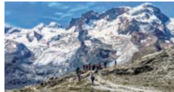
▲ゴルナー氷河を眼下にブライトホルンを望む

【日程】①夕刻、東京発→欧州・中東経由都市へ ②→チューリッヒ ③グリンデルワルト ④アイガー北壁ハイキング ⑤パツハアルプゼーハイキング ⑥ツェルマット ⑦マッターホルン展望ハイキング ⑧リッフェル湖ハイキング ⑨シャモニ ⑩グランドジョラス展望ハイキング ⑪ジュネーブ→欧州・中東経由都市 ⑫→東京着