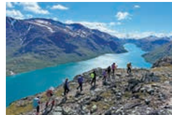
▲ベッセゲン尾根手前から前方に広がるイェンデ湖

【日程】①夕刻、東京発→欧州・中東經由都市 ②→オスロ ③ イェンデスハイム ④ ベッセゲン尾根往復ハイキング ⑤ イェンデブー ⑥ イェンデトゥンガ登頂ハイキング ⑦ 縦走トレッキング/レイルバスブーへ ⑧ 縦走トレッキング/スピテルストウレン ⑨ ガルホピッゲン登頂 ラウベルグストウレン ⑩ オスロ散策 ⑪→欧州・中東經由都市 ⑫→東京着