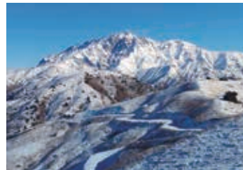
▲西天山グレーター・チムガン山