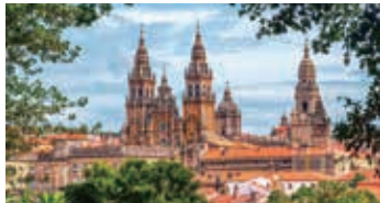
▲巡礼路のゴールはサンティアゴ・デ・コンポステーラ