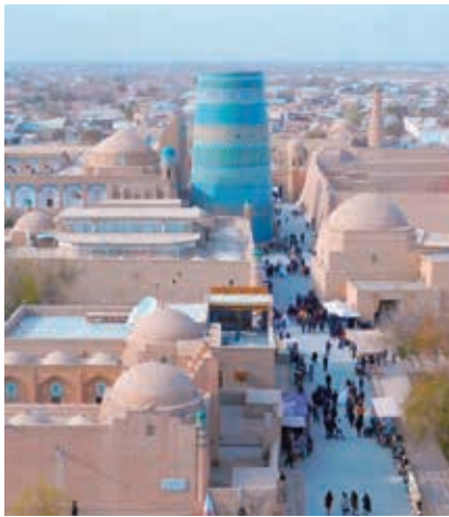
▲ヒヴァの内城イチャン・カラは中世の姿

古来の中央アジア・シルクロードの面影を色濃く残すウズベキスタン。交易の中継地として財を蓄積しオアシス都市に中央アジアのイスラム文化として壮麗な建築物を残しました。今なお中世の雰囲気を色濃く残す城郭都市のヒヴァとブハラ、シルクロードの中心都市“青の都”サマルカンド、自然遺産の西天山と交易路ザラフシャン＝カラクム回廊の世界遺産を巡ります。