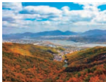
▲アチャ山から眺める漢江