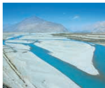
▲シャヨク川とヌブラ川が合流するヌブラ谷