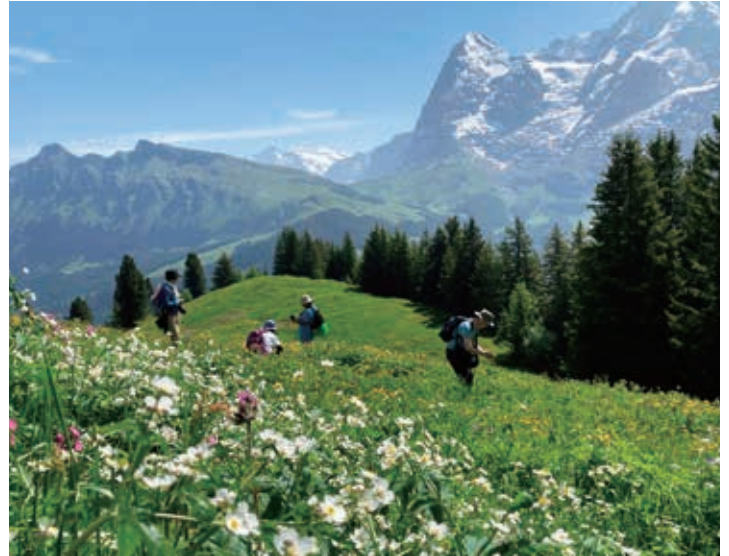
▲雪が残り眩しく輝くベルナーオーバーラント三山

※積雪・残雪等の状況によっては、ハイキングができない場合があります。ツアーリーダーが別のハイキングへご案内いたします。 ※天候状況により展望台観光の日程が前後する場合があります。 ※予定のハイキングコースは天候との条件により変更される場合があります。登山電車代、ロープウェイ代などは旅行代金に含まれておりません。(総額の目安は約12,800円です。)