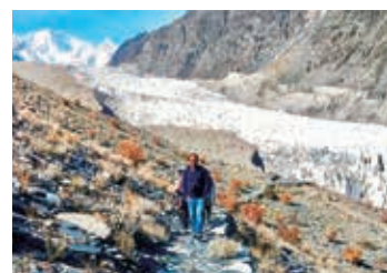
▲パス-氷河を眼下に歩く