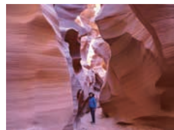
▲ 美しい迷路アンテロープキャニオン

鉄砲水と風の力によって作られたアンテロープキャニオン。壮大で神秘的な景観は見る者を魅了します。赤やオレンジに色を変えるキャニオンの中は美しい迷路です。