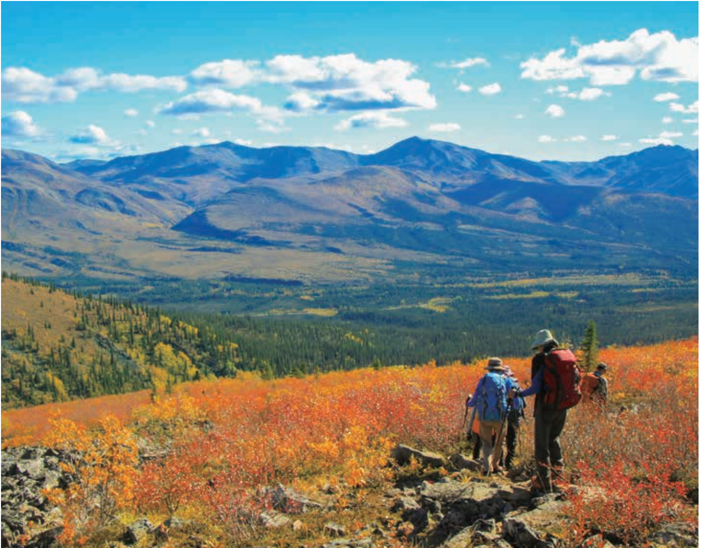
▲山や大地が赤や黄色に色づく秋のユーコン。雄大な手付かずの自然を満喫します。