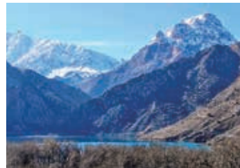
▲イस्कンダール湖とファン山脈