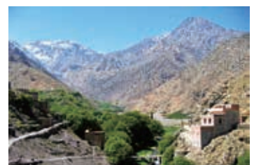
▲北アフリカ最高峰のツブカル山