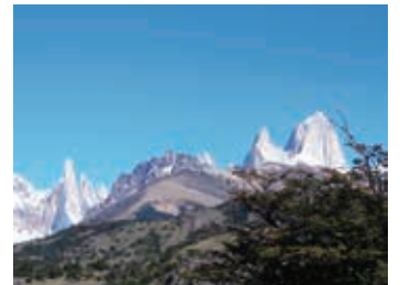
▲セロトーレとフィッツロイを望む展望台より

世界中のクライマーたちを魅了し続けるフィッツロイ山群。そこにはセロ・トーレ (3,128m) やフィッツロイ (3,405m) をはじめとする芸術的とまでいえる3,000m級の岩峰群が立ち並んでいます。