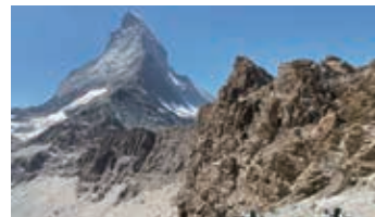
▲ヘルンリ稜をゆっくり登りヘルンリ小屋へ

マッターホルン登山の基地となる標高3,260mに建つ山小屋。すぐ裏手にそそり立つマッターホルンの迫力ある姿は一度はその目で見た憧れの景色です。