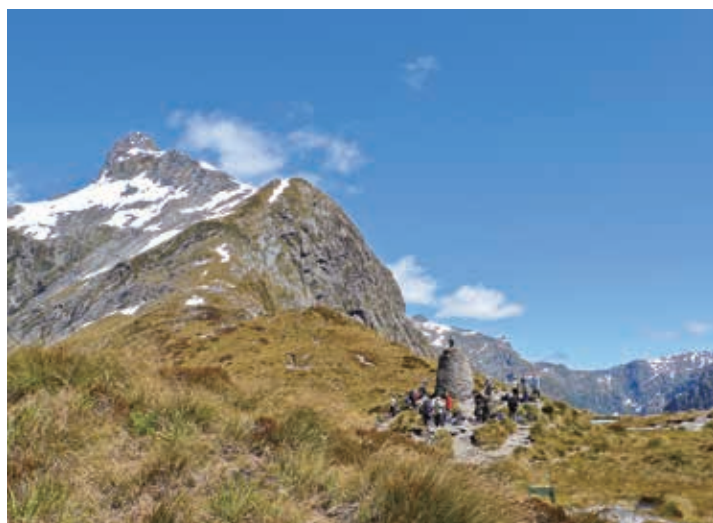
▲ミルフォード、マックノン峠

※ビジネスクラス、プレミアム・エコノミーをご希望の方はお問い合わせください。 ※ロッジには温水シャワー、乾燥室があります。 ※ロッジでの宿泊は男女別相部屋になります。