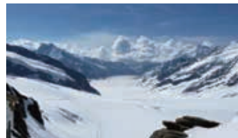
▲世界遺産のアレッチ氷河

アイガーを貫くトンネルの終点でヨーロッパ最高所の鉄道駅。ヨーロッパアルプス最大のアレッチ氷河の源頭部で白銀の山々と氷河の絶景が堪能できます。