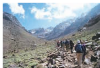
▲ムフロン小屋に向かって谷沿いの山道を行く

【日程】①夕刻、東京発→欧州・中東經由都市 ②→カサブランカ ③→ マラケシュ ④→ イミウグラード ⑤→ ツブカル山登山1日目/イディ・アイッサ ⑥→ ツブカル山登山2日目/アジブ・タムスール小屋 ⑦→ ツブカル山登山3日目/ムフロン小屋 ⑧→ ツブカル山登山4日目/ツブカル山登頂 ⑨→ ツブカル山登山5日目/イムリル村 ⑩→ マラケシュ市内観光 ⑪→カサブランカ→欧州・中東經由都市 ⑫→東京着