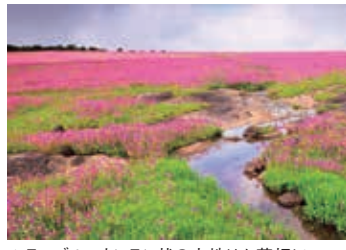
▲テーブルマウンテン状の大地はお花畑に

【日程】①午前、東京・大阪発→東南アジア經由→ムンバイ ② サジャンガード城見学 サタラ ③ 世界遺産・西ガーツ山脈フラワーハイキング ④ 西ガーツ山脈フラワーハイキング ⑤ アウランガーバード ⑥ 世界遺産アジャンター石窟群見学 ⑦ 世界遺産エローラ石窟群見学 ⑧ ムンバイ→ ⑨→東南アジア經由→夜、東京・大阪着