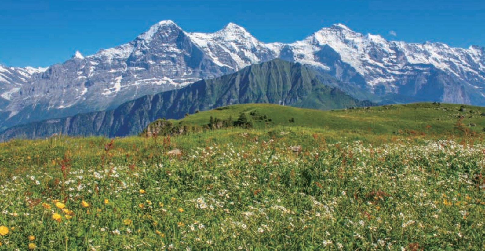
▲お花畑の向こうにアイガー、メンヒ、ユングフラウのヘルナー・オーバーラント三山の絶景を楽しめるのはスイス・アルプス・フラワーハイキングならではのです。