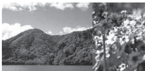
▲中禅寺湖上から見る高山の山容。花はクリンソウ

★食事・入浴：昼食は各自行動食をご持参ください。下山後時間により温泉に立ち寄ります。(別料金)