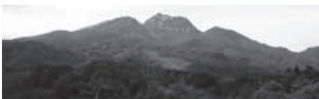
▲いもり池から見上げる妙高山