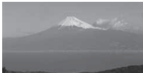
▲だるま山レストハウス裏から駿河湾を隔てて富士南面

★食事・入浴：昼食は各自行動食をご持参ください。下山後時間により温泉に立ち寄ります。(別料金)