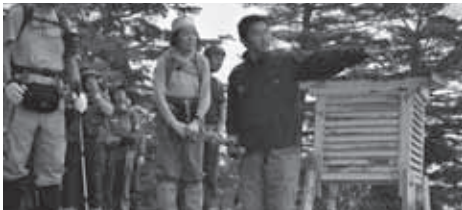
▲気象の変化を観察しましょう!

★食事：朝1回、夕1回 (1日目および2日目の昼食は各自行動食をご持参ください)。下山後時間により温泉に立ち寄ります。(別料金)