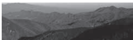
▲甲武岳山頂からの展望