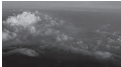
▲観天望気をしながら山を歩こう!

★食事：なし (昼食は各自行動食をご持参ください)。下山後時間により温泉に立ち寄ります。(別料金)