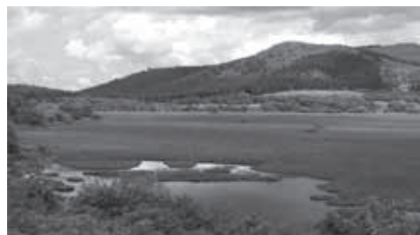
▲数々の池塘を渡る八島湿原

★食事：なし (昼食は各自行動食をご持参ください)。下山後時間により温泉に立ち寄ります。(別料金)