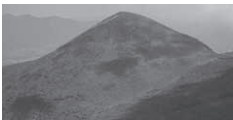
▲編笠を伏せたような山容

★食事・入浴: 昼食は各自動食をご持参ください。下山後時間により温泉に立ち寄ります。(別料金)