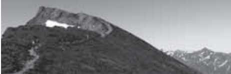
▲非対称山稜の白馬岳

★食事：朝2回、昼2回、夜2回 (2日目の朝食および昼食は各自行動食をご持参ください)。下山後時間により温泉に立ち寄ります。(別料金)