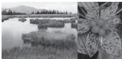
▲アヤマメ平から至仏山を眺める。実はゴゼンタチバナ

★食事・入浴：昼食は各自行動食をご持参ください。下山後時間により温泉に立ち寄ります。(別料金)