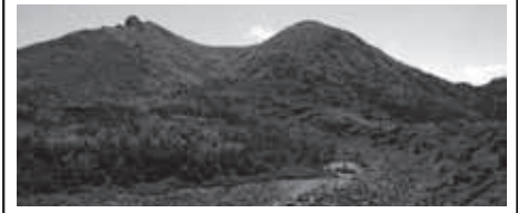
▲八ヶ岳の名峰 天狗岳

★食事：朝1回、昼1回、夕1回 (1日目の昼食は各自行動食をご持参ください)。下山後時間により温泉に立ち寄ります。(別料金) ※各自オリエンテーリング用のコンパスをご持参ください。