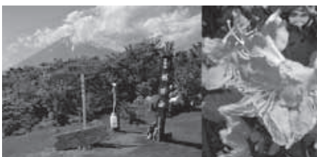
▲富士山を間近に望む越前岳山頂。花はアシタカツツジ

★食事・入浴：昼食は各自行動食をご持参ください。下山後時間により温泉に立ち寄ります。(別料金)