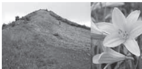
▲山頂直下から見る飯盛山。花はニッコウキスゲ

★食事・入浴：昼食は各自行動食をご持参ください。下山後時間により温泉に立ち寄ります。(別料金)