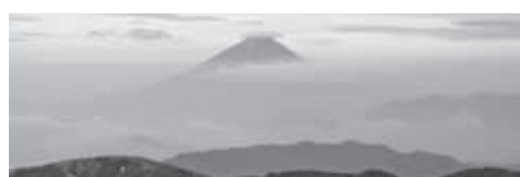
▲北岳からの富士山

★テントやシュラフなどの装備は各自での準備が必要です。詳細は事前の机上講座でご説明します。