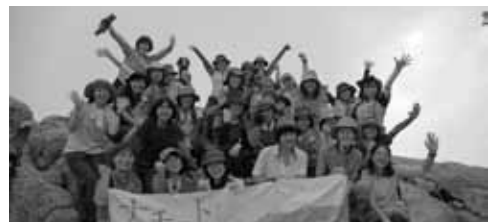
▲レディース・トレッキング

●最少催行人数：12人 ●同行：講師とツアーリーダー（2～3人） ●締切：各出発日の2週間前 ●定員：20人（宿泊コースは16人）