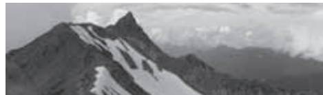
▲いざ、憧れの槍の穂先へ!

詳細は、ホームページや国内ツアー用ブログ「山へ行こうよ」でもご覧いただけます。 山へ行こうよ アルパインツアー 日本 検索