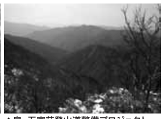
▲泉・五家荘登山道整備プロジェクト