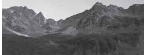
▲濁沢から見上げる穂高連峰

100 ● 鎖岩場 テント ▲歩行時間・2日目:約8時間 3日目:約7時間 ▲6kg~8kg程度のザックを背負い、連続する標高差1000mの登りを4時間以内で登れる体力が必要です。 【期間】10月12日(金)~10月14日(日) 参加費用 ¥33,000 【集合・時間】JR・甲府駅中央改札前 (10:40) 【ポイント】山の団十郎といわれる甲斐駒ヶ岳と、南アルプスの女王と呼ばれる仙丈ヶ岳。山男塾の集大成として、北沢峠にテント泊で定着し、南アルプスの秀峰2座に登頂します。テントでの連泊では、山での生活技術全般が要求されます。 1日目 甲府駅 広河原 ● 北沢峠 (2036m) ● 2日目 ▲仙丈ヶ岳 ▲甲斐駒ヶ岳 (2967m) ▲双児山 ▲北沢峠 (2030m) ● 3日目 ▲小仙丈ヶ岳 ▲仙丈ヶ岳 (3033m) ▲北沢峠 ● 広河原 ▲ 甲府駅 17:00~19:00(予定) ★食事: なし (行程中の夕食と朝食はすべて自炊になります。行動食を含め、食糧は各自ご準備ください) ★山男塾の必修科目を修了した方 (I~Ⅲ期) 限定の講座です。また、直近の山行歴によっては、ご参加をお断りする場合がございます。