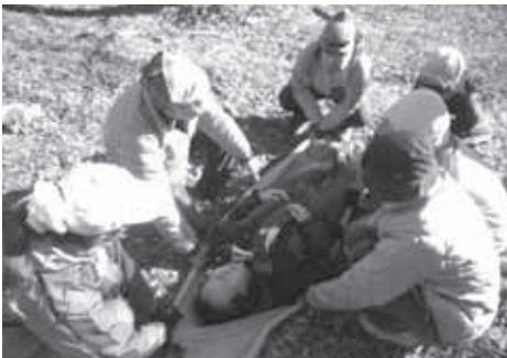
▲ファーストエイドと搬送法を実習

★ファーストエイドに必要な装備は各自での準備が必要です。詳細は事前の机上講座でご説明します。