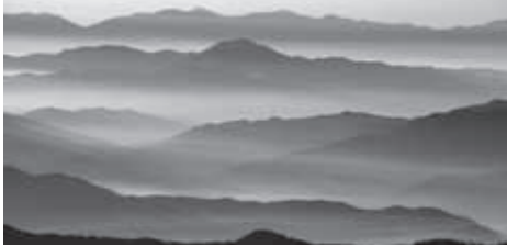
▲大黒岳付近から眺望する朝の山並み

詳細は、ホームページや国内ツアー用ブログ「山へ行こうよ」でもご覧いただけます。 山へ行こうよ アルパインツアー 日本