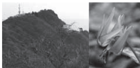
▲双耳峰の男体山から望む最高峰の女体山。花はカタクリ

★食事・入浴：昼食は各自行動食をご持参ください。下山後時間により温泉に立ち寄ります。(別料金)