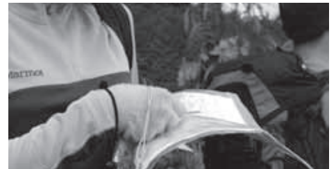
▲さてと、今はどこかな

歩行時間:約4時間 4kg~6kg程度のザックを背負い、10km程度の平坦地を3時間以内で歩ける体力が必要です。 参加費用 ¥7,000 【集合・時間】JR青梅線御嶽駅改札前(8:30) 御嶽駅 徒ケーブル下・滝本駅 徒御岳山駅(820m) 徒武蔵御岳神社 徒日の出山(902m) 徒ひので三ツ沢つるつる温泉 徒武蔵五日市駅 17:30(予定) ★食事・入浴:昼食は各自行動食をご持参ください。時間により温泉に立ち寄ります。(別料金)