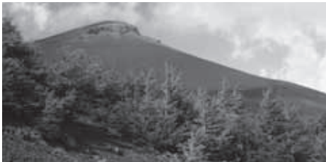
▲富士宮口・新六合目から望む富士山・宝永山

★食事・入浴：朝2回、昼2回、夕2回(1日目の昼食は各自行動食をご持参ください)。下山後時間により温泉に立ち寄ります。(別料金)