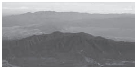
▲富士山・宝永山から俯瞰した愛鷹山塊(手前)

★食事・入浴：昼食は各自行動食をご持参ください。下山後時間により温泉に立ち寄ります。(別料金)