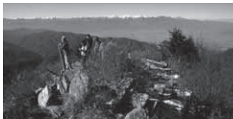
▲甲府盆地を隔てて南アルプスを一望する釈迦ヶ岳の山頂

★食事・入浴：昼食は各自行動食をご持参ください。下山後時間により温泉に立ち寄ります。(別料金)