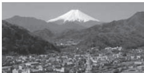
▲岩殿山は秀麗富嶽十二景のひとつ

★食事・入浴: 昼食は各自動食をご持参ください。下山後時間により温泉に立ち寄ります。(別料金)