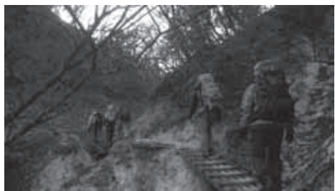
▲雨山峠へ続く沢沿いの登山道

★プレート型コンパスおよび該当エリアの地形図は各自での準備が必要です。詳細は事前の机上講座でご説明します。