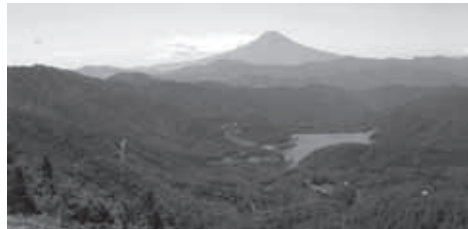
▲富士展望の頂を連ねる大菩薩嶺線(雷岩付近から富士山)

★食事・入浴：朝1回、昼1回、夕1回(1日目の昼食は各自行動食をご持参ください)。下山後時間により温泉に立ち寄ります。(別料金)