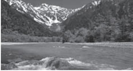
▲清冽な梓川と残雪の穂高連峰