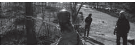
▲立木などを使ってロープワークを実践

★ロープやハーネスなどの装備は各自での準備が必要です。詳細は事前の机上講座でご説明します。