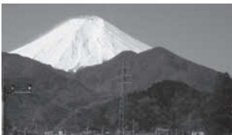
▲山麓部から仰ぐ富士山北面と倉見山(4月下旬)

★食事・入浴：昼食は各自行動食をご持参ください。下山後時間により温泉に立ち寄ります。(別料金)