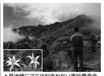
▲早池峰にゴミは似合わない実行委員会