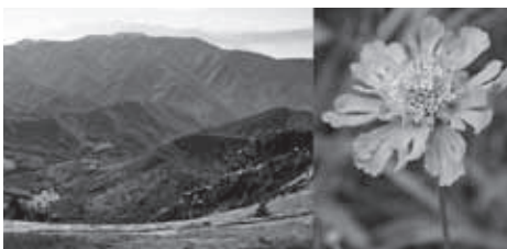
▲美ヶ原から望む高ボッチ・鉢伏山。花はマツムシソウ

★食事・入浴：昼食は各自行動食をご持参ください。下山後時間により温泉に立ち寄ります。(別料金)